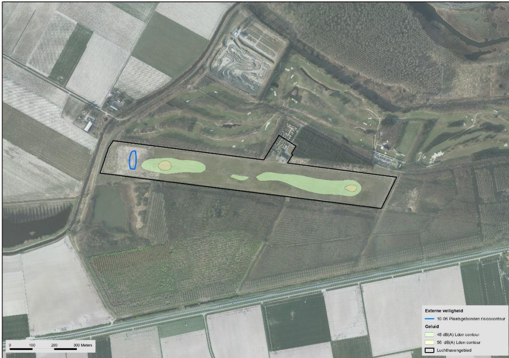
Figuur 1: Ligging van het luchthavengebied, de 48 en 56 L_{den} geluidscontouren en de plaatsgebonden risicocontour ( 10^{-6} )

In figuur 1 zijn het luchthavengebied en de ligging van de 48 en 56 L_{den} geluidscontouren en de plaatsgebonden risicocontour ( 10^{-6} ) aangeven.