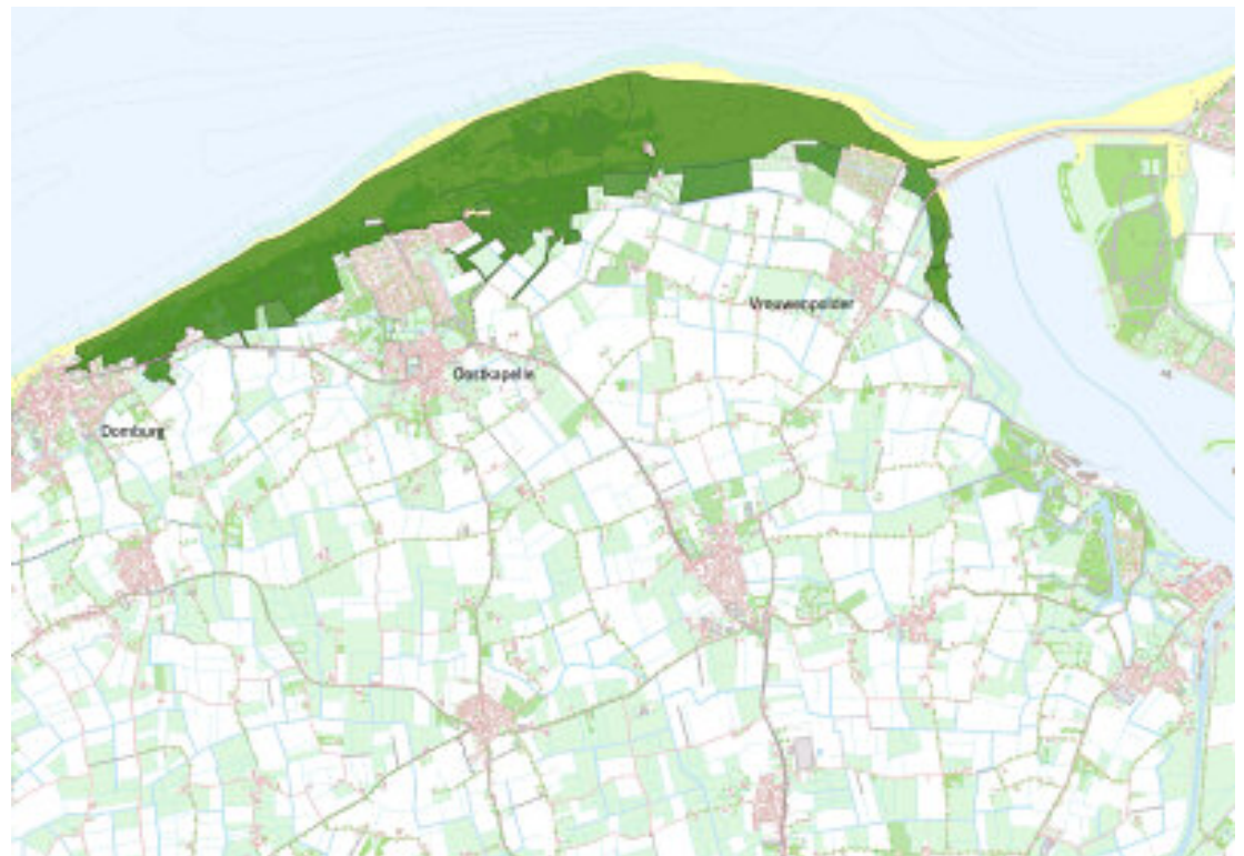
Begrenzing van het Natura 2000-gebied

De duïnen zijn reliëfrijk aan de zeezijde en zacht golvend meer landinwaarts. In de Manteling van Walcheren zijn ook historische buitenplaatsen te vinden met gemengd loofbos en stinzenplanten. Dit zijn verwilderde, in het voorjaar bloeiende planten, zoals narcis, sneeuwkllokje en sleutelbloem, die door de vroegere bewoners zijn aangeplant. Onder de met duïnzand opgewaaide kuststrook heeft zich een zoetwaterbel gevormd. In de (natte) duïnvalleien en aan de randen reikt deze bel tot aan het maaiveld. Dat biedt prima omstandigheden voor bijzondere, vochtminnende plantensoorten, zoals geelhartje en parnassia.