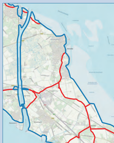
Overzichtskaart met primaire (blauw) en regionale (rood) waterkeringen

In de gemeente Reimerswaal liggen veel regionale waterkeringen, die van belang zijn. De Zanddijk is ook een regionale waterkering. Uit het onderzoek Normering Regionale Waterkeringen is naar voren gekomen dat de Zanddijk van groot belang is bij doorbraak van de primaire kering aan de Ooster- en Westerschelde. Uit dit onderzoek blijkt ook dat de Zanddijk niet opgehoogd hoeft te worden. Wel gaan we de Zanddijk verbreden en versterken. De Zanddijk ophogen zorgt niet voor meer waterveiligheid. Een hogere Zanddijk zou in de voorgelegen polder voor meer slachtoffers kunnen zorgen, omdat een soort 'badkuip' wordt gecreëerd met hogere randen.