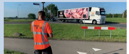
Landmeter bij rotonde Nishoek

Op dit moment hoort of ziet u wellicht niet zoveel over het project, maar dat wil niet zeggen dat er niets gebeurt. Integendeel! De afgelopen maanden (medio april tot en met eind juni) voerden landmeters van bureau Basepoint (hoogte)metingen uit op grond waar in de nabije toekomst werkzaamheden verricht worden. Deze gegevens zijn cruciaal voor het maken van het ontwerp van de weg en voor het bepalen van een nauwkeurige grondbalans. Om het ontwerp definitief te maken is nog meer informatie nodig, waaronder gegevens uit verkeersmodellen en onderzoeken.