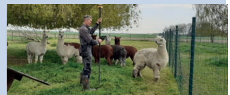
Het gevoel bekeken te worden

Bij het project hebben wij ook te maken met langs liggende en kruisende kabels en leidingen. Denk aan hoogspanningskabels, transportleidingen, distributieleidingen en telecommunicatiekabels. Hierover zijn inmiddels de eerste gesprekken gevoerd met de kabel- en leidingbeheerders en daarbij is nu vooral bekeken waar de belangrijkste kabels en leidingen liggen en wat met deze kabels en leidingen moet gebeuren. Kortom: wij staan niet stil en kijken vooral vooruit!