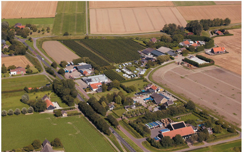
Zanddijk met Kaasgat op de achtergrond

Het totale project kost 67,4 miljoen euro. Provincie Zeeland realiseert en financiert het grootste deel van het project. Daarnaast dragen gemeente Reimerswaal, waterschap Scheldestromen en Rijkswaterstaat financieel bij aan maatregelen op het gebied van fietsveiligheid en het toekomstig beheer van wegen en waterlopen. Ook voert gemeente Reimerswaal het traject rotonde Wulk-Molendijkseweg en de aanpassingen op de Koringaweg uit.