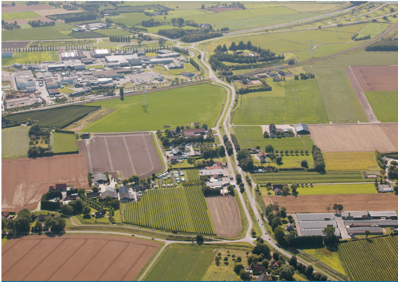
Huidige Zanddijk N673