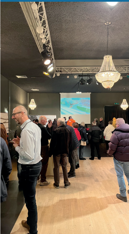
Informatiebijeenkomst bedrijven 18 jan.2023.

18 januari 2023 organiseerden we een inloopavond voor bedrijven uit gemeente Hulst. Deze avond informeerden we een vijftigtal belangstellenden over de geplande werkzaamheden en mogelijke omleidingsroutes.