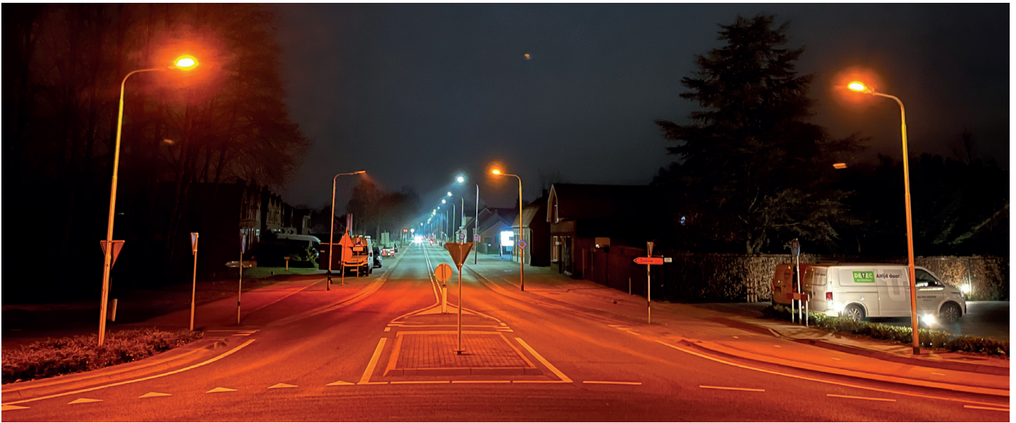
▲ Amberkleurige verlichting aan de rotonde op de grens met België. In de verte de standaard witte verlichting.

Verkeersveiligheid is het belangrijkste. De lantaarnpalen mogen bijvoorbeeld niet te dicht tegen de weg komen. Stel een vrachtwagen moet uitwijken, dan is het niet de bedoeling dat hij tegen lantaarnpalen botst. We moeten ook rekening houden met fiets- en/of voetpaden naast de weg. Daarnaast willen we voorkomen dat een lantaarnpaal pal voor iemands