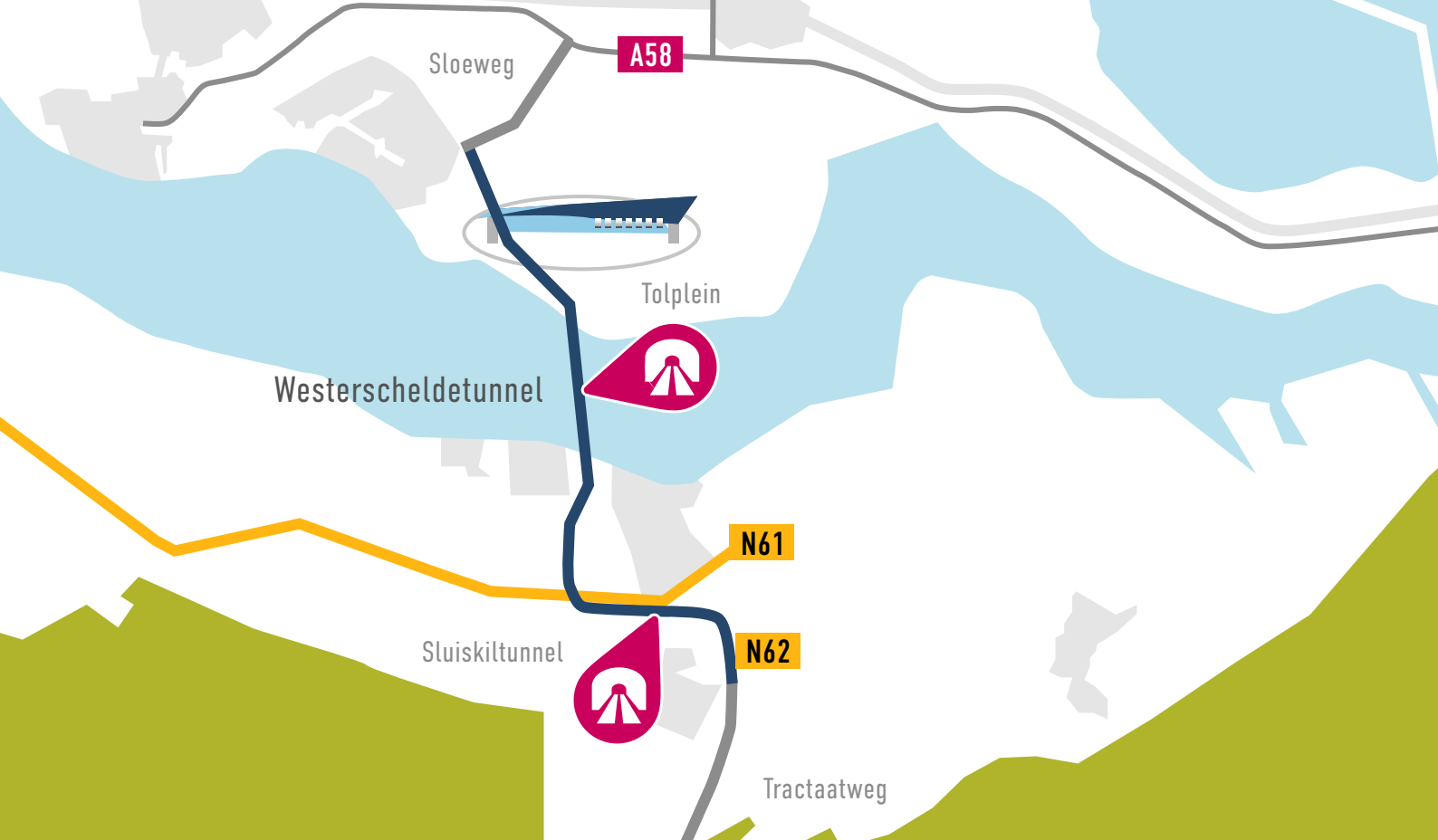
Figuur 1, kaartbeeld van de tunnel

De werkgroep adviseert het referentietarief op nihil te stellen. Daarmee wordt de tunnel voor de gebruiker gratis. Dit kan door het tarief in de "Vaststellingsregeling eerste referentietarief N.V. Westerscheldetunnel" op nihil te stellen door middel van een ministeriële regeling. De vigerende Tunnelwet Westerscheldetunnel blijft daarbij ongewijzigd in stand. Een onderdeel van de procedure om te komen tot een ministeriële regeling is het in kaart brengen van de neveneffecten die verwacht worden door dit besluit.