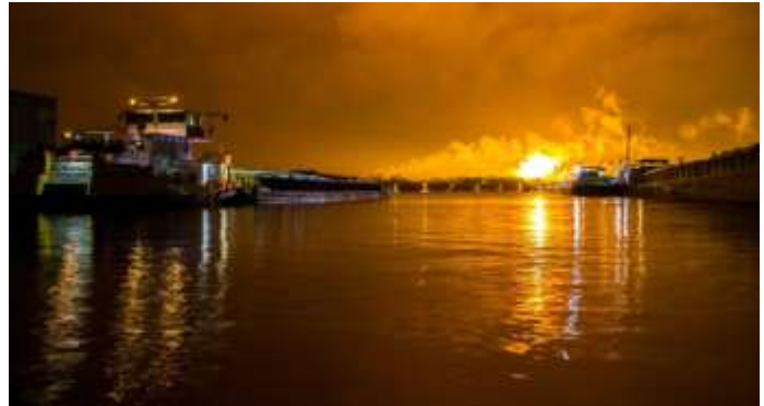
Afbeelding 2 affakkelen

Brzo-bedrijven krijgen ook in de media veel aandacht. In Zeeland worden op dit moment met name de casussen rondom de ontmanteling van de voormalige fosforfabriek Thermphos en de overschrijding van de stofuitstoot bij de productie van ureum door Yara door zowel betrokken instanties als omwonenden en de media nadrukkelijk gevolgd, getuige onder meer de berichtgeving in de lokale media alsmede de reacties van burgers daarop. 9 Ook werkzaamheden die op zichzelf geen risico vormen voor omwonenden, kunnen door hen als verontrustend worden ervaren. Een voorbeeld hiervan is het zgn. "affakkelen" door Dow en Zeeland Refinery. 10