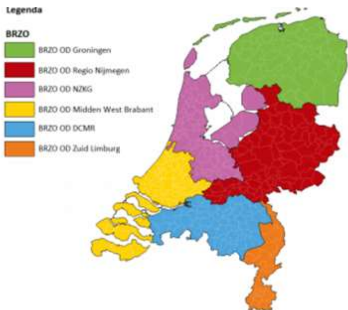
Afbeelding 3: Regio-indeling Brzo-omgevingsdiensten

Richting de Tweede Kamer geeft de staatssecretaris van Infrastructuur en Milieu medio februari 2012 aan dat zij de aanbevelingen van de Onderzoeksraad voor Veiligheid in zijn rapport over de brand bij Chemie-Pack in Moerdijk op 5 januari 2011 bijzonder relevant vindt voor de op te zetten en in te richten Brzo-infrastructuur. 48 Overeenkomstig deze aanbevelingen is een programma van eisen voor de