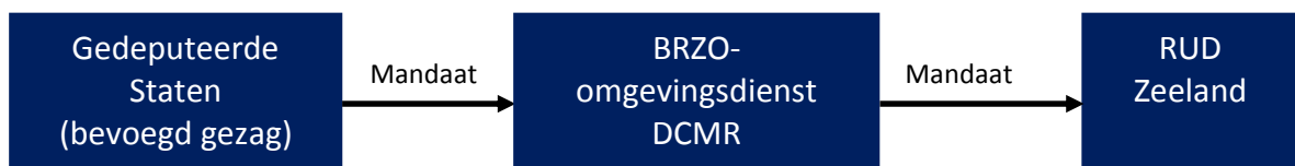
Figuur xx Mandaat en Ondermandaat vth-taken Brzo

Het College van Gedeputeerde Staten is het bevoegd gezag voor Brzo-bedrijven. Het zijn van bevoegd gezag betekent, dat GS belast zijn met zogenoemde vth-taken: vergunningverlening, toezicht en handhaving. Dat doen de gedeputeerden niet zelf; de uitvoering van deze taken is gemandateerd aan gespecialiseerde omgevingsdiensten. Voor Zeeland is dat DCMR, Milieudienst Rijnmond in Schiedam, die voor de feitelijke taakuitoefening in dit gebied samenwerkt met de Regionale Uitvoeringsdienst (RUD) Zeeland. In bijlage 4 wordt uitvoerig ingegaan op de organisatie van de RUD Zeeland. Om DCMR daartoe van de nodige bevoegdheden te voorzien is aan de directeur van die dienst door Gedeputeerde Staten mandaat verleend.