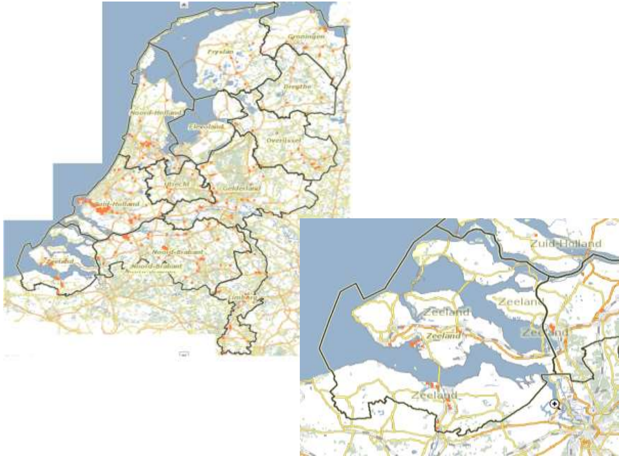
Afbeelding 1 Spreiding Brzo-bedrijven, Nederland en Zeeland 4

Om een beeld te krijgen over welke bedrijven het in Zeeland gaat, zijn in tabel 1 de bedrijven, hun vestigingsplaats en een korte omschrijving weergegeven.