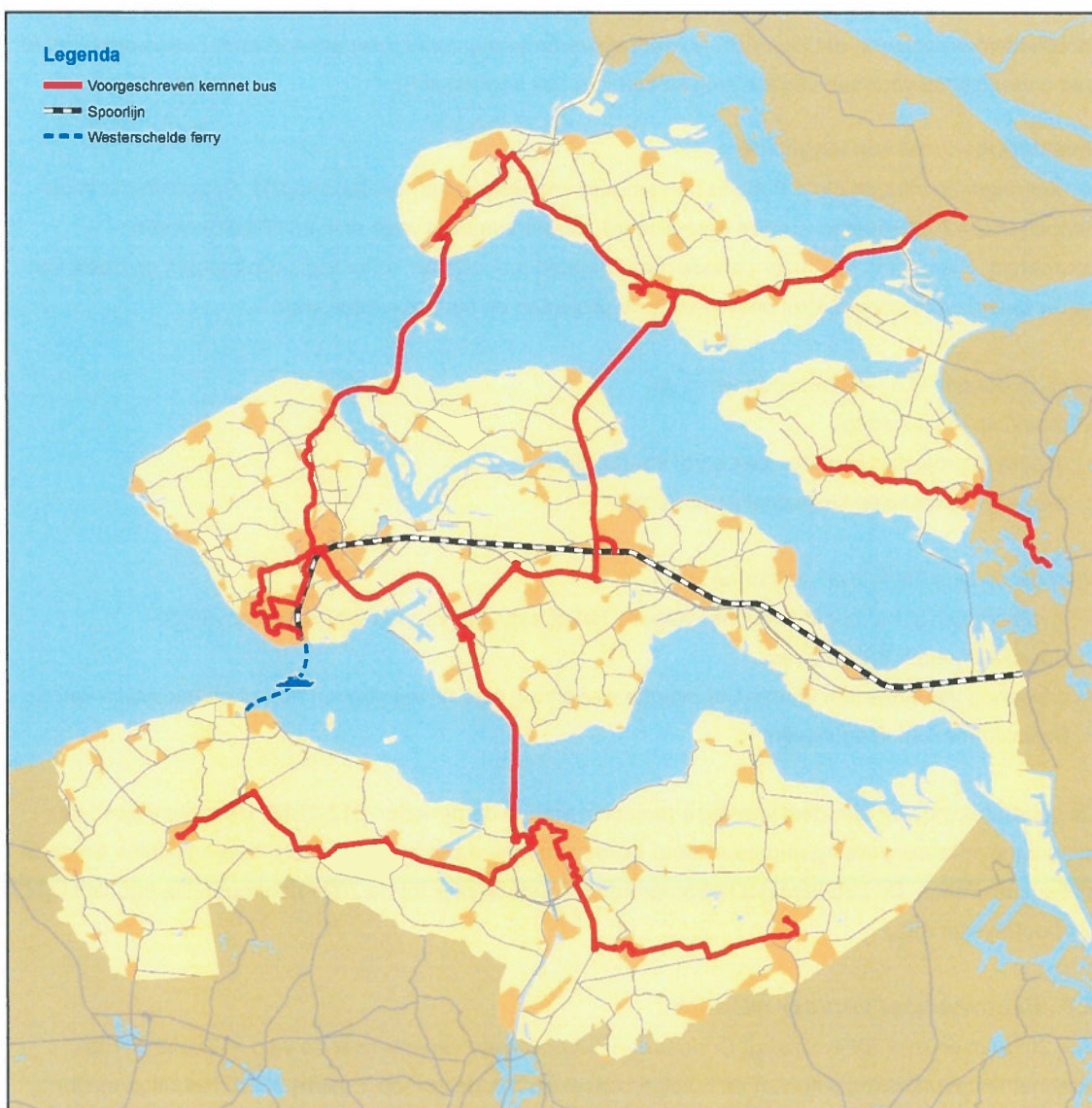
Westerschelde Ferry, treinverbinding en het voorgeschreven kernnet