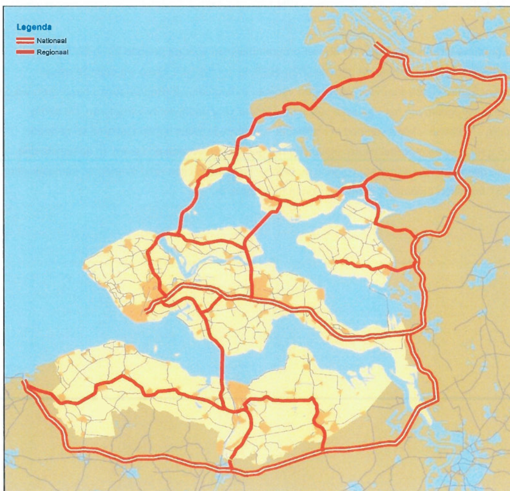
Hoofdwegennet in en rond Zeeland

Het Zeeuwse hoofdwegennet verbindt de afzonderlijke delen van onze provincie met elkaar, met de Randstad, de Brabantse stedenrij en met Vlaanderen. Het hoofdwegennetwerk staat weergegeven op onderstaande kaart.