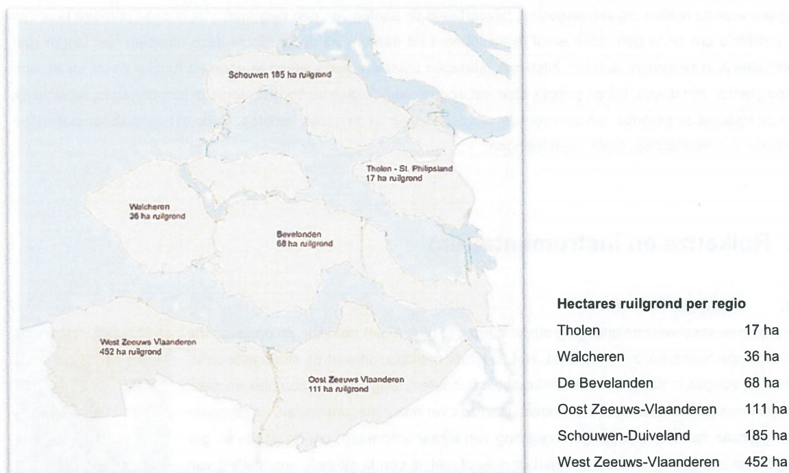
Figuur 2 Provinciale grondvoorraad

Uitgangspunt is dat de provincie niet meer grond in eigendom heeft dan noodzakelijk is om doelen (op termijn) te kunnen bereiken. Dat betekent dat grondverwerving afgewogen moet worden tegen eventuele mogelijkheden om het doel te realiseren zónder dat de provincie de grond in eigendom heeft (bijvoorbeeld samenwerkingsvormen).