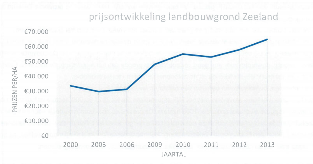
Figuur 1 Prijsontwikkeling landbouwgrond Zeeland

extremen buiten beschouwing zijn gebleven. Ook transacties in familiale zin en van gehele bedrijven (met gebouwen) zijn uitgesloten. In de grafiek zijn onder meer de gevolgen van de internationale kredietcrisis goed zichtbaar. Aandeelhouders zijn gevlucht in de veilige belegging 'grond' wat de prijs (sterk) heeft opgedreven.