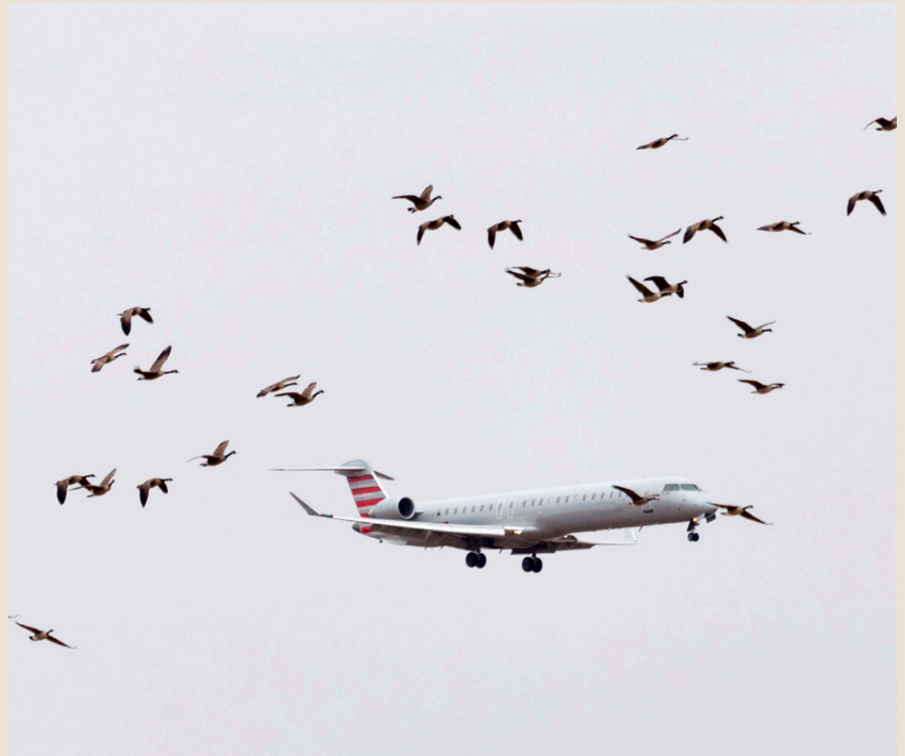
Vogels kunnen het vliegverkeer ernstig hinderen

want het advies is uiteindelijk een herijking van de praktijk die in de laatste vijftien jaar al onder hun verantwoordelijkheid was gegroeid.