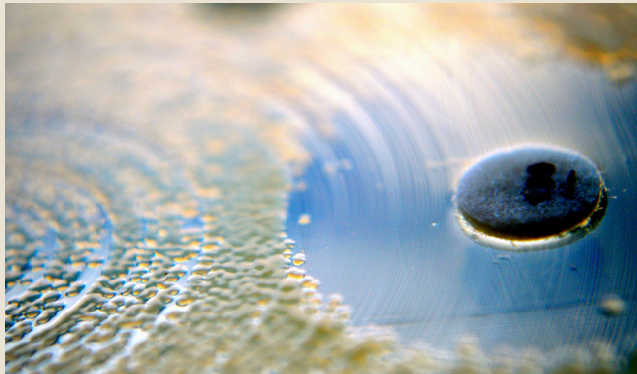
Bacteriekweek in petrischaal