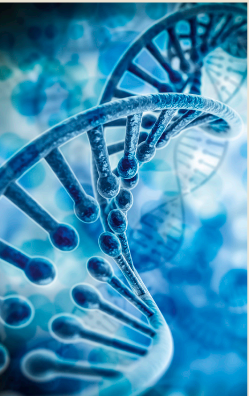
Model van DNA-string