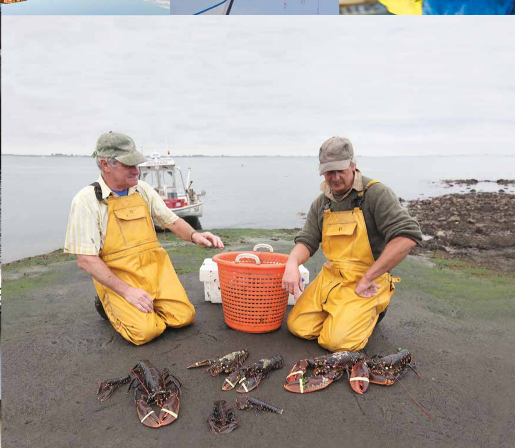
BORSELE GOES HULST KAPELLE MIDDELBURG NOORD-BEVELAND PROVINCIE ZEELAND REIMERSWAAL SCHOUWEN-DUIVELAND SLUIS TERNEUZEN THOLEN WATERSCHAP SCHELDESTROMEN VEERE VLISSINGEN