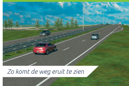
Zo komt de weg eruit te zien

U kunt ons volgen op Facebook en Twitter: @Tractaatweg.