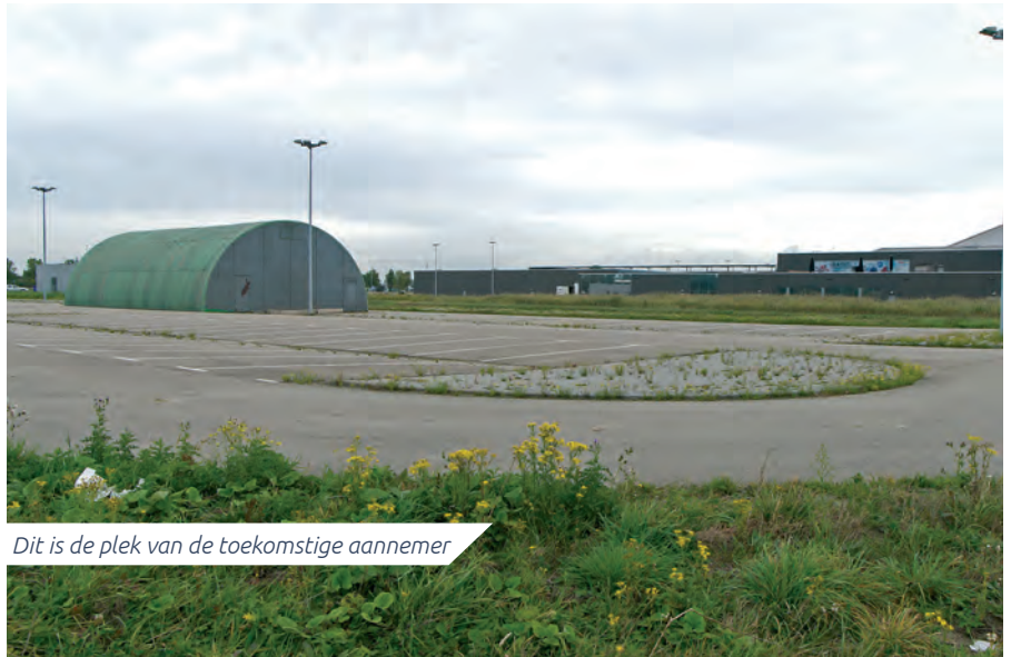
Dit is de plek van de toekomstige aannemer