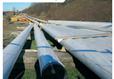
22 km kabels en leidingen

In en langs het tracé liggen vele kabels en leidingen voor elektriciteit, gas, water en de industrie. We leggen in totaal 22 kilometer kabels en leidingen. Ter voorbereiding van de verbreding zijn al veel kabels en leidingen verlegd. In februari 2016 zijn grote gestuurde boringen rond het kruispunt Axelse Sassing uitgevoerd. Tijdens de werkzaamheden aan de Tractaatweg zal de aannemer ook nog kabels en leidingen omleggen, omdat deze nu nog onder de weg liggen.