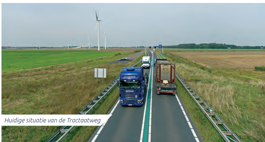
Huidige situatie van de Tractaatweg

De Tractaatweg BV werkt, in opdracht van de Provincie Zeeland, aan een bredere Tractaatweg met nieuwe kruisingen. Sinds de komst van de Westerscheldetunnel en de Sluiskiltunnel is het een stuk drukker geworden op deze route. Voor de zomer van 2017 starten de werkzaamheden aan de verbreding van de weg. We zijn op weg naar 2019: dan is de weg verdubbeld naar twee keer twee rijstroken.