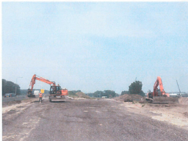
Werkzaamheden bij de afrit Nieuwdorp

De afrit van de Bernhardweg West N254 naar Nieuwdorp is sinds 21 maart buiten gebruik voor het verkeer. De nieuwe afrit wordt in het weekend van 29 juni afgebouwd en zal op maandag 2 juli in gebruik worden genomen door het verkeer.