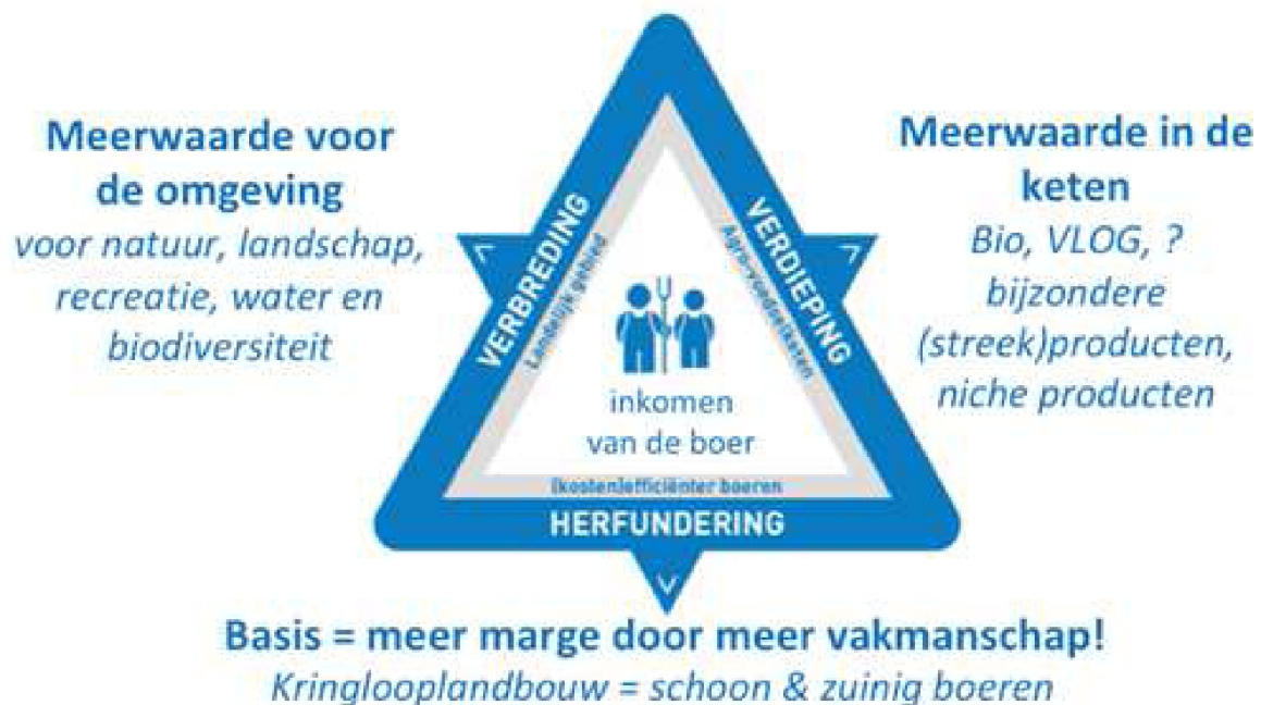
Figuur 2: Meerwaarde creëren op het agrarisch bedrijf

Een oplossing waarbij partijen gezamenlijk er naar streven om te komen tot meerwaarde op en rond het agrarisch bedrijf. Via een aanpak die (individuele) boeren bovendien in staat stelt om te komen tot maatregelen op het eigen bedrijf op een manier die het best past binnen hun eigen bedrijfsstructuur (zie figuur 2). Maatregelen die bijdragen aan een gezond en robuust verdienmodel voor de agrarische sector.