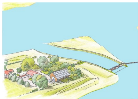
Rechts: Oestergeul bij hoog tij +0,55 NAP