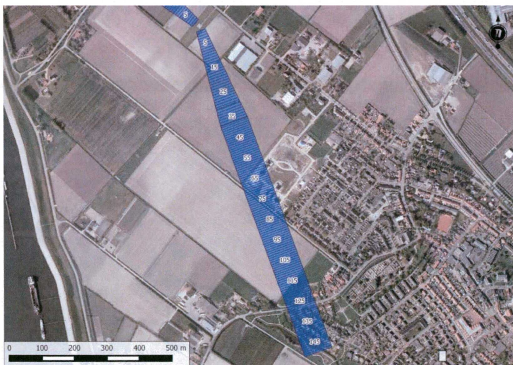
Figuur 1b: Wettelijke hoogte beperkingen obstakels binnen de zuidelijke aanvliegroete van een helikopterplatform (als voorbeeld bestaande locatie Inter Scaldes)