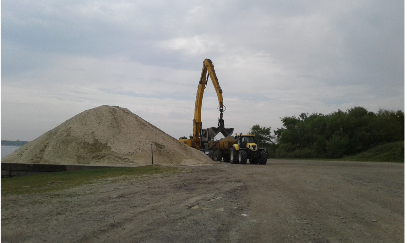
Foto 1: laden en lossen op de loswal van Rijkswaterstaat aan de Brouwersdam.

In het voorjaar heeft op het strand van Herkingen een eenmalige actie plaats gevonden i.v.m. vergrassing en afslag van het strand. Om het afgeslagen deel te herstellen is circa 250 kubieke meter zand aangevoerd en aangebracht. Daar waar vergrassing van het strand had plaats gevonden is de toplaag verwijderd en het afgegraven materiaal met een mobiele trommelzeef gezeefd. Het daarbij vrij gekomen zand is weer op het strand aangebracht. Met de gemeente is afgesproken de kosten 50/50 te delen waardoor er voor het Schap een eenmalige onverwachte uitgave heeft plaatsgehad van 5.402 euro.