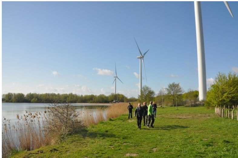
Windmolens nabij strand “Hellegat”

De extensiveringsmaatregelen zijn grotendeels in het TBM en in de praktijk doorgevoerd.