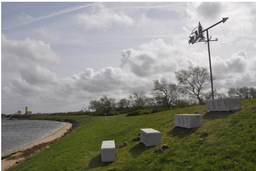
Zit- beleefelement nabij Expostrand te Stellendam

De peildatum is 30 juni 2017, maar de focus ligt in de rapportage steeds op het hele jaar 2017. De jaarlasten inzake de dienstverlening Staatsbosbeheer zijn voor het gehele jaar 2017 reeds in de realisatiecijfers per 30 juni verwerkt.