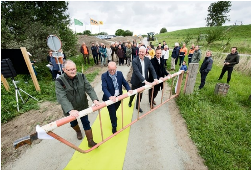
Op 26 mei 2017 zijn de Slikken van Flakkee officieel geopend.