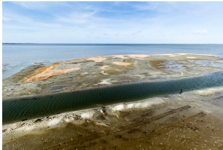
Aanleggen vogeleiland nabij Slikken van Flakkee

Het programma ZOG 2 is in het AB in juli 2016 vastgesteld. De nadruk ligt op nieuwe groene projecten. Zie met name het krediet Groene Impuls in bovenstaande tabel. Nadere invulling hiervan vindt plaats in samenspraak met omgevingspartijen. Daarnaast is er in ZOG-2 een toeristisch-recreatief deel met deels projecten die doorlopen vanuit ZOG-1 en enkele nieuwe initiatieven.