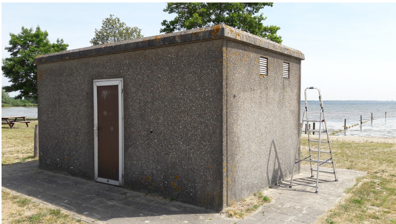
Foto 4: technische inspectie van het toiletgebouw bij 'De Banaan'.