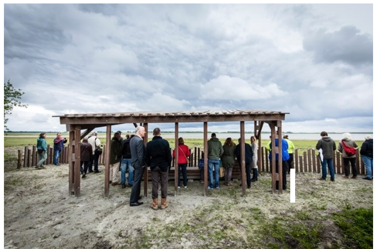
Wilduitkijkpunt Slikken van Flakkee