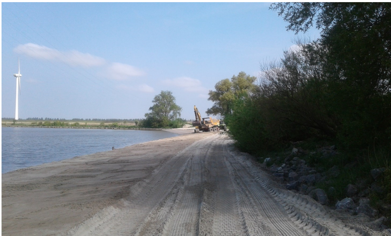
Foto 6: strand Cromstrijen West kant in de afronding van het groot onderhoud.

Foto 5: strand Cromstrijen West tijdens uitvoering van het groot onderhoud.