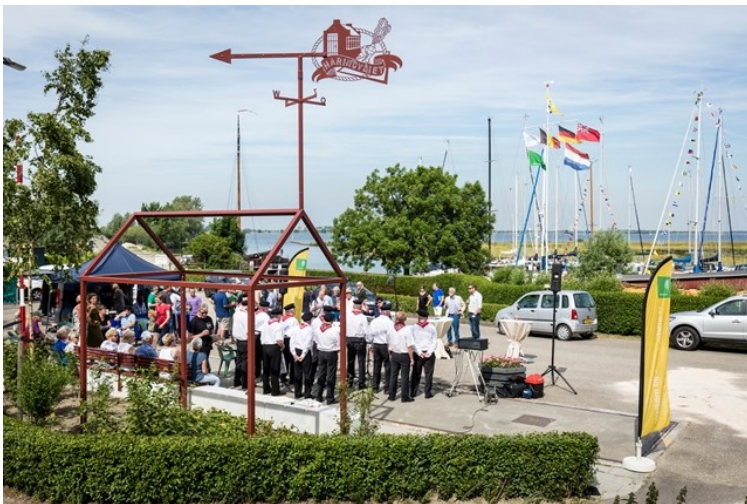
Opening Zit-beleefelement Den Bommel