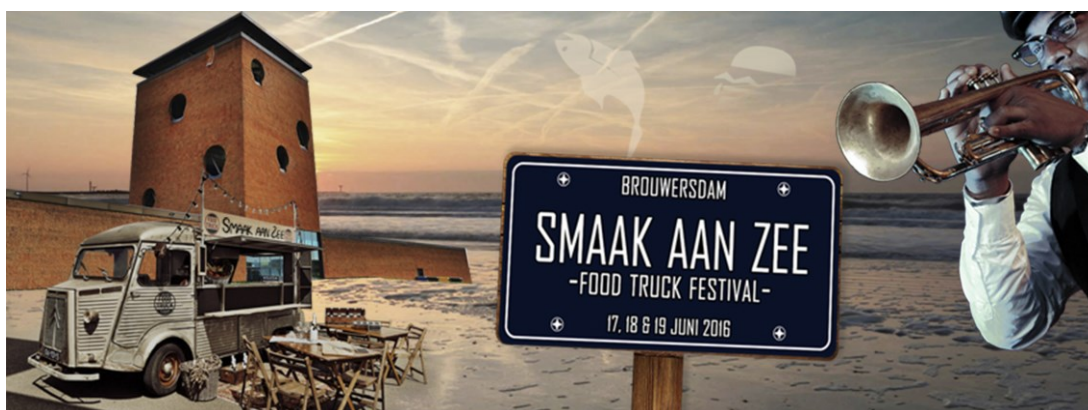
Affiche Foodtruckfestival juni 2016

Het informatiecentrum Grevelingen wordt m.i.v. mei 2017 tijdelijk geëxploiteerd door Staatsbosbeheer.