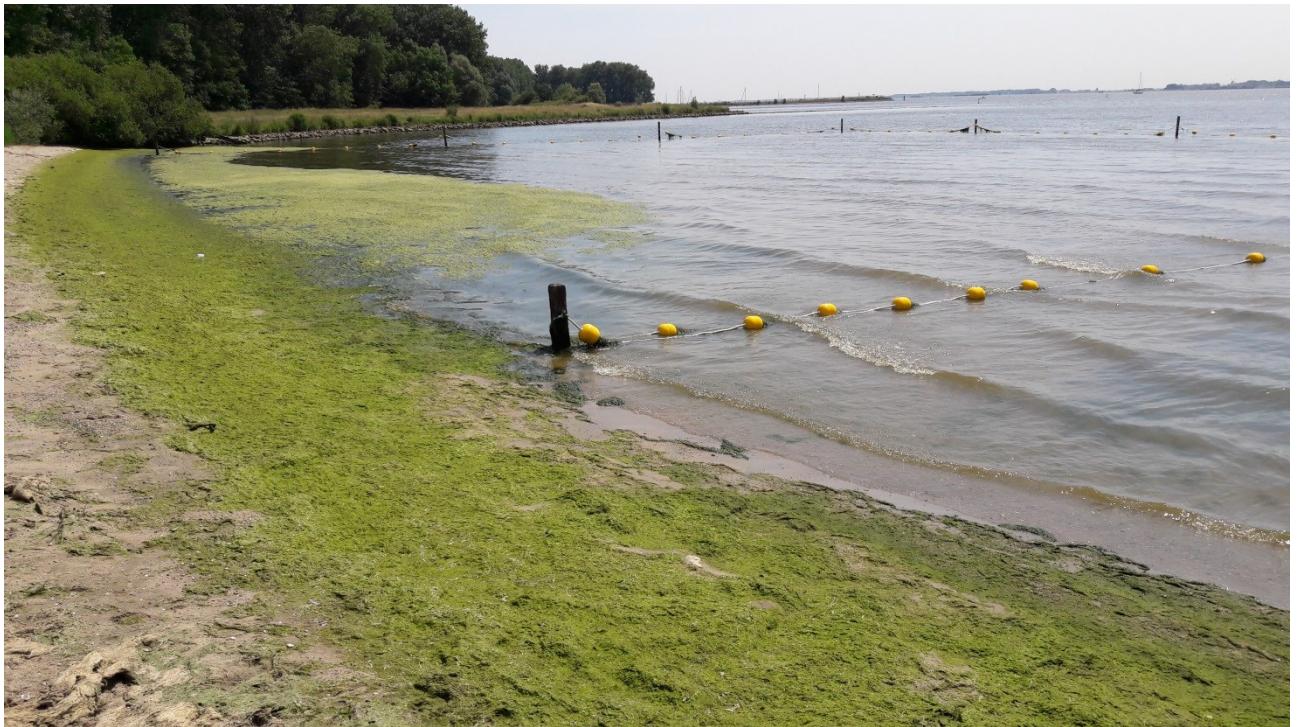
Foto 3: aangespoeld wier en waterplanten bij het strand van Cromstrijen.

De hoeveelheid wier die er in het recreatieseizoen gaat aanspoelen op de stranden van het Haringvliet is ook elk jaar weer een verrassing. Het opruimen hiervan is en blijft altijd een hele klus en eenmaal opgeruimd kan het strand een paar dagen later zomaar weer vol liggen. Het volgen van het weerbericht en de windrichting is in het recreatieseizoen dan ook 'vaste prik'.