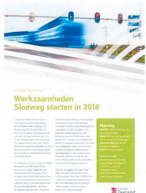
Infoblad Sloeweg, december 2017

De website www.sloeweg.nl gebruiken we als belangrijkste nieuwsbron. Informatie op de website vullen we steeds aan. Ook zetten we projectenpagina @Sloeweg op Facebook en het twitteraccount van de Provincie Zeeland (@provzeeland) in om media en de omgeving op de hoogte te houden van het project Sloeweg fase II. Op 31 december 2017 hadden we 52 vind-ik-leuks op onze Facebookpagina.