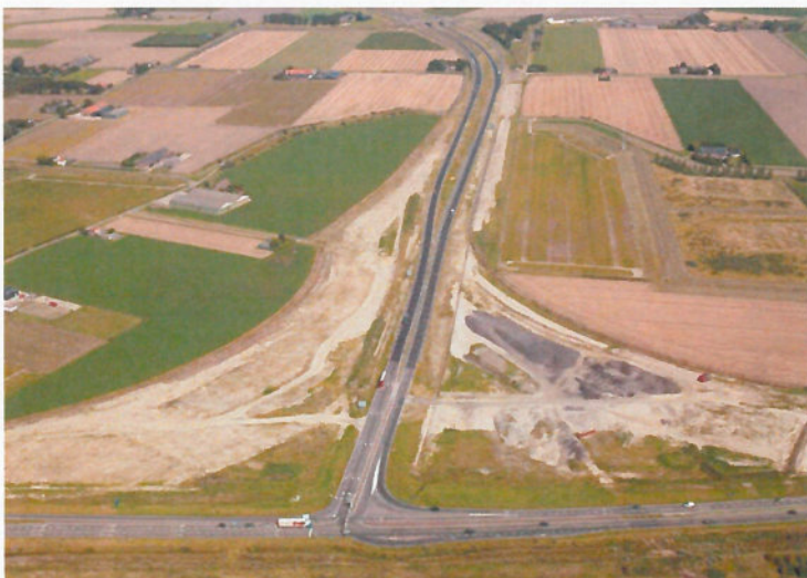
Kruispunt Sloeweg Bernhardweg Westerscheldetunnelweg

De werkzaamheden zijn in het vierde kwartaal van 2017 verder afgerond en er is eind 2017 een contractwijziging overeengekomen met de aannemer Boskalis, zodat de uitvoeringswerkzaamheden in 2018 en 2019 kunnen gaan plaatsvinden.