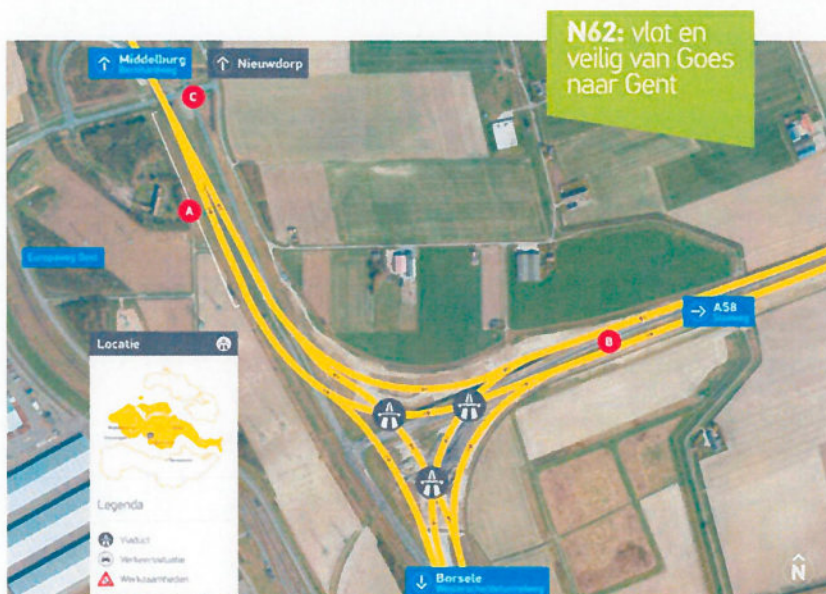
Visualisatie van de fasering voor het bouwen van het knooppunt Sloeweg (december 2017)

Naast de drie hoofdfaseringen zijn er meerdere kortdurende faseringsmomenten voor aansluitingen, omzettingen e.d. Deze kortdurende faseringen zullen hoofdzakelijk in een nacht of in een weekend plaatsvinden. Hierover zal telkens tijdig worden gecommuniceerd naar de omgeving.