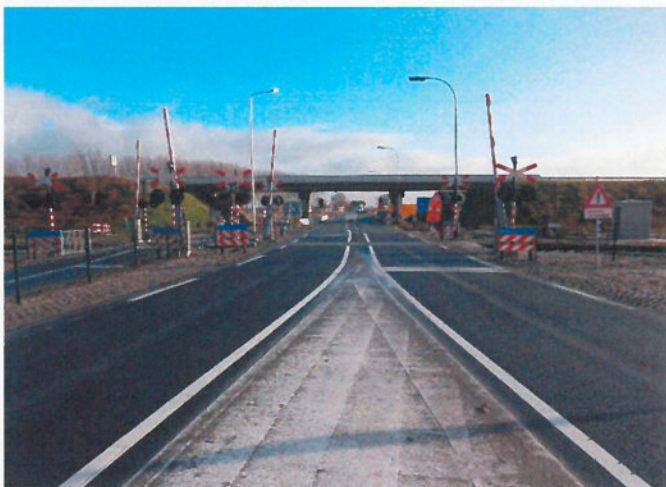
Kruising Axelse Sassing met beveiligde spoorwegovergangen

Vervolgens is Boskalis in 2017 gestart op verschillende kunstwerken met de voorbelasting van opritten naar landhoofden en de verschillende wegvakken. Tevens is de rechter hoofdrijbaan tussen Axelse Sassing en Zwartenhoek op de deklaag na gerealiseerd.