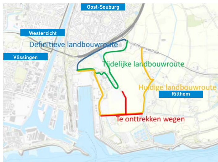
Landbouwroute Vlissingen - Sloegebied

Door het gebied van de nieuwe kazerne lopen twee openbare wegen, de Havenweg en de Visodeweg. Per 1 april 2018 worden deze twee wegen aan de openbaarheid onttrokken, zoals in het Inpassingsplan van de Provincie is aangekondigd. De procedure is in gang gezet en is naar verwachting voor het einde van dit jaar afgerond. De Havenweg maakt onderdeel uit van de landbouwroute op Walcheren. Om de weg aan de openbaarheid te kunnen onttrekken is een vervangende landbouwroute nodig. Uiteindelijk gaat de verlengde Marie Curieweg