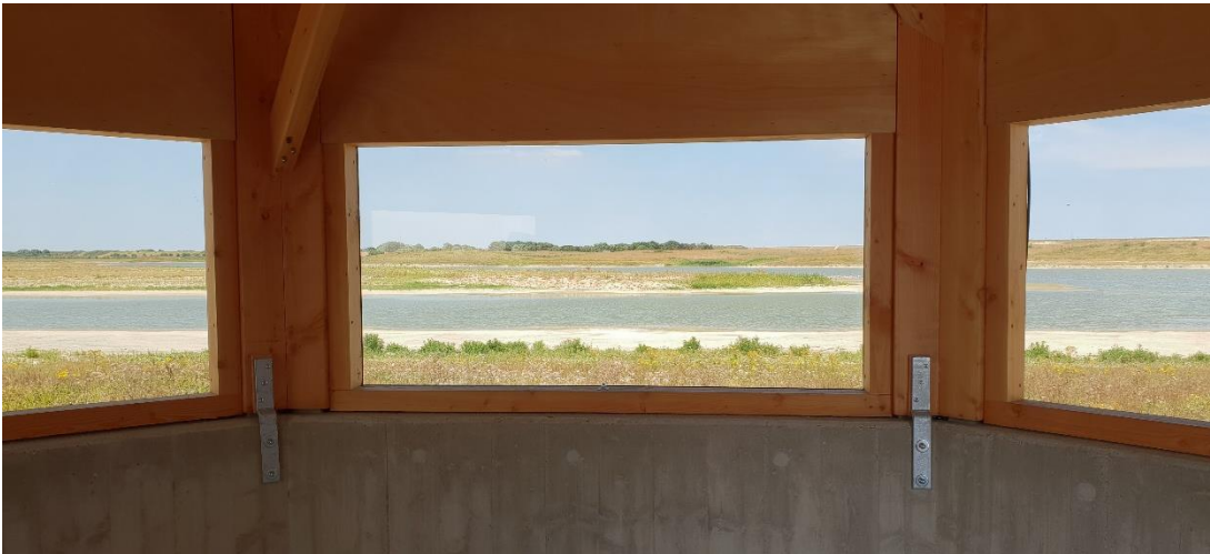
Figuur 1: blik op Waterdunen vanuit recent aangelegde vogelkijkhut

Dit alles maakt Waterdunen een landelijk voorbeeldproject op het gebied van innovatieve gebiedsontwikkeling.