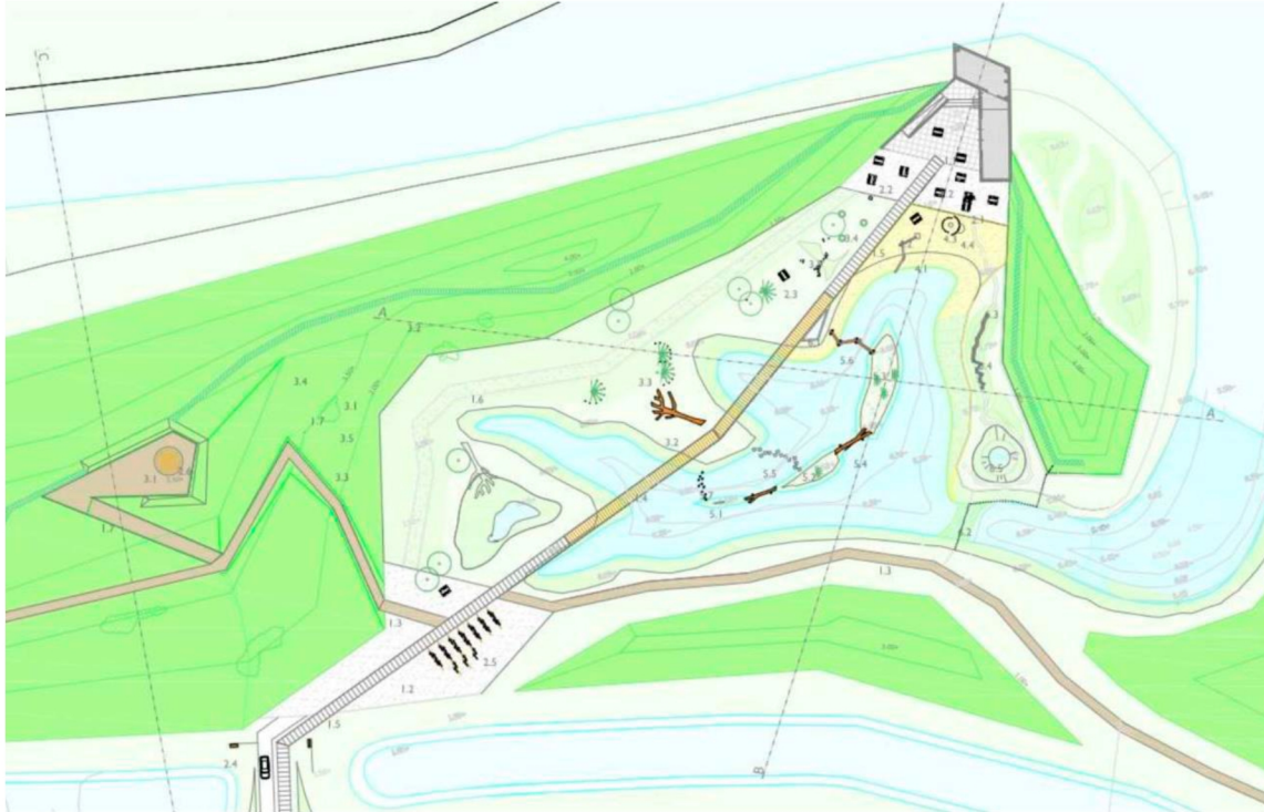
juni 2017: impressie Welkom in Waterdunen

Het Zeeuwse Landschap werkt momenteel een voorstel uit om voor een entreevoorziening gecombineerd met speelnatuur. Zij verzoeken de Provincie het budget uit de GREX 2017 voor speelnatuur en voor de grote vogelkijkhut in te brengen in hun plan, waarna zij dit voor eigen risico realiseren. Daarbij wordt aanvullende financiering ingezet: een bijdrage van Molecaten voor speelnatuur, een bijdrage van Het Zeeuwse Landschap vanuit haar budget voor de kleinere vogelkijkhutten en een eventuele bijdrage vanuit het Rood voor Groenfonds. Medio 2018 is goedkeuring gegeven voor extra bijdrage Rood voor Groen door gemeente Sluis.