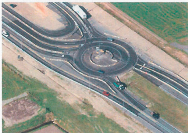
Luchtfoto tijdelijke rotonde