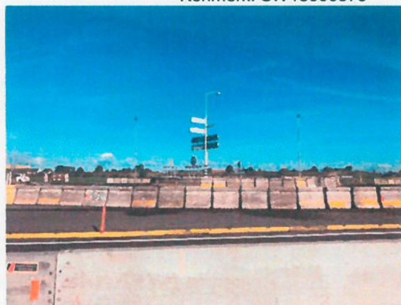
Zij aanzicht tijdelijke rotonde