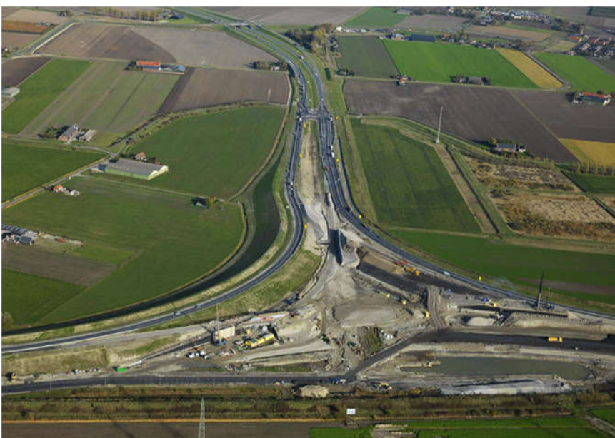
Kruispunt Sloeweg Bernhardweg Westerscheldetunnelweg met tijdelijke rotonde (november 2018)

In september 2018 is een tijdelijke rotonde geopend (verkeersfasering fase 3). Dankzij het gebruik van deze tijdelijke rotonde kan de aannemer veilig de viaducten en de binnenste verbindingbogen realiseren. Sinds de ingebruikname van de tijdelijke rotonde is gebleken dat deze zorgt voor een veilige en vlotte doorstroming van het wegverkeer in alle rijrichtingen.