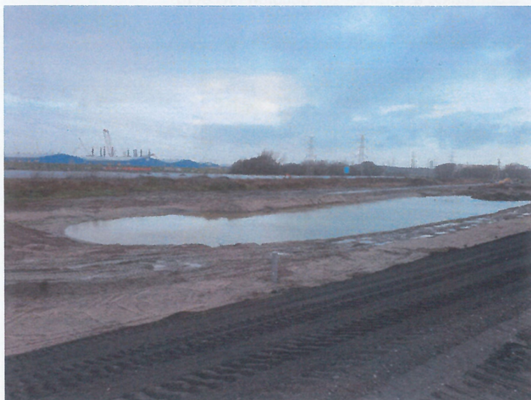
Waterberging Knooppunt Drie Klauwen

Aan de kant van Vlissingen-Oost is een start gemaakt met het graven van de waterberging van 8.000 vierkante meter. Bij extreme neerslag wordt het water opgevangen in deze berging. De verwachting is dat begin 2019 de beplanting wordt aangebracht. Een rij wilgen vormt dan een visuele grens tussen het knooppunt Sloeweg en de bedrijvigheid van het Sloegebied / Haven Vlissingen-Oost.