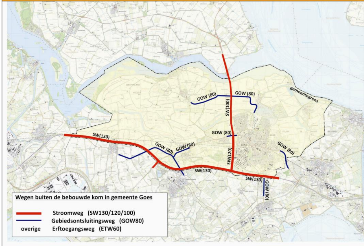
Afbeelding: Categoriseringsplan Goes buiten bebouwde kom zoals opgenomen in GVVP2013