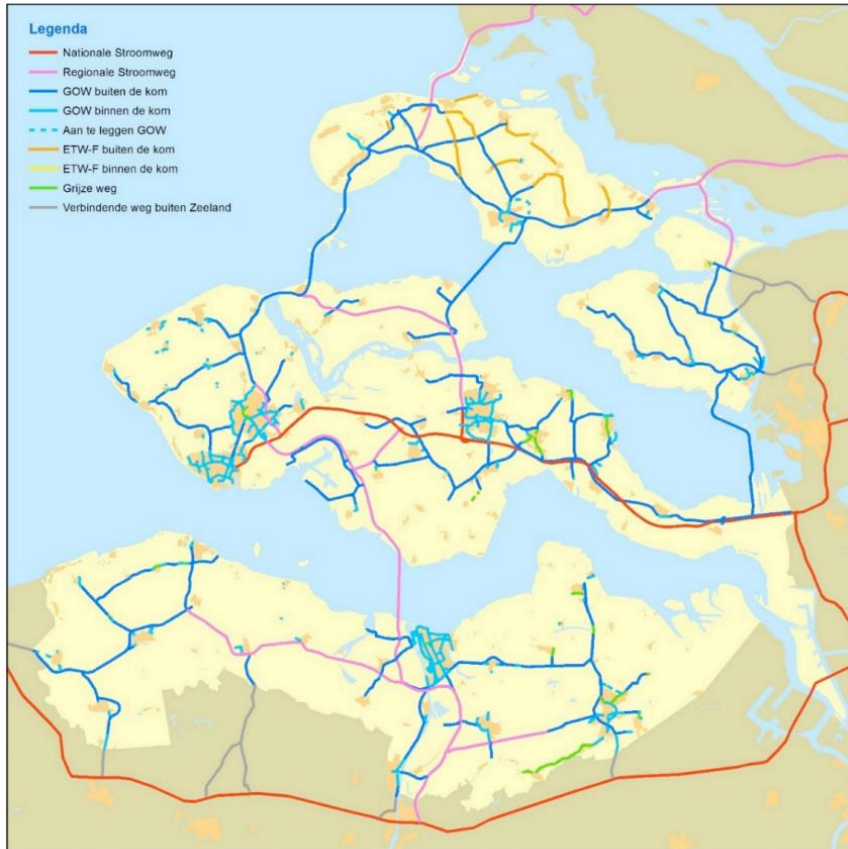
Afbeelding: Categoriseringsplan Zeeland zoals opgenomen in concept-Mobiliteitsplan 2016