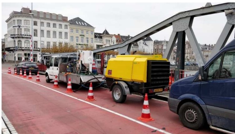
Figuur 2: Voertuig tijdens uitvoering onderzoek op brugdek.

De bus en het langzaam verkeer kon hierdoor normaal doorgang vinden tijdens de werkzaamheden.