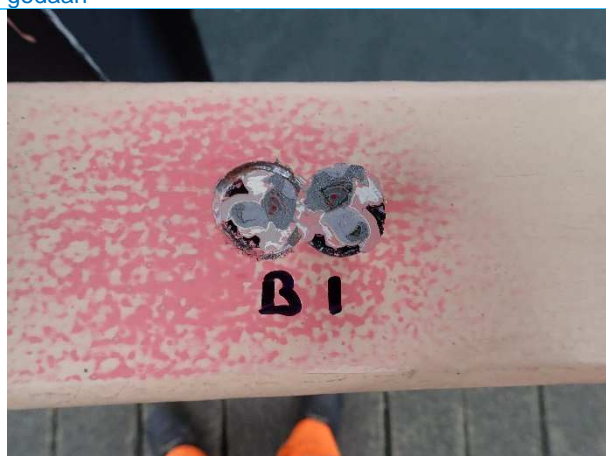
Foto 5: meetresultaat pull off test op leuning Zuidzijde. Waarde 4,51 MPa, gecompliceerd breukvlak a.g.v hoeveelheid lagen en onderlinge hechting