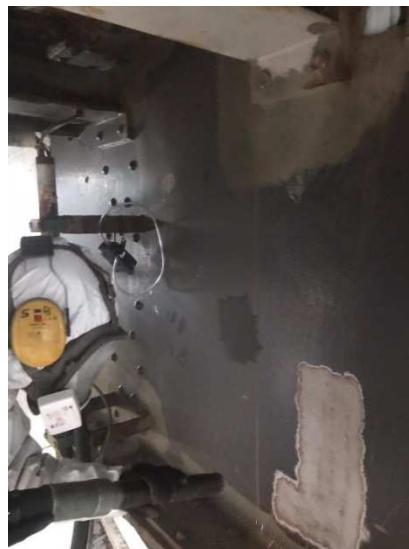
Figuur 4: Een gestraald proefvak.

De proeflocatie-locatie is vooraf geïnspecteerd en ingericht. Hierbij gaat het voornamelijk om afschermen, beveiligen en het aansluiten van apparatuur waaronder de compressor. Voor het afschermen van de locatie is gebruik gemaakt van 10% luchtdoorlatend windreductiedoek en opgespannen rondom de te stralen locatie. Dit doek is aangebracht om te voorkomen dat het straalmiddel weg kan waaien van de werklocatie en voorkomt derhalve eventuele overlast voor de omgeving alsmede dat het opruimwerkzaamheden bevordert.