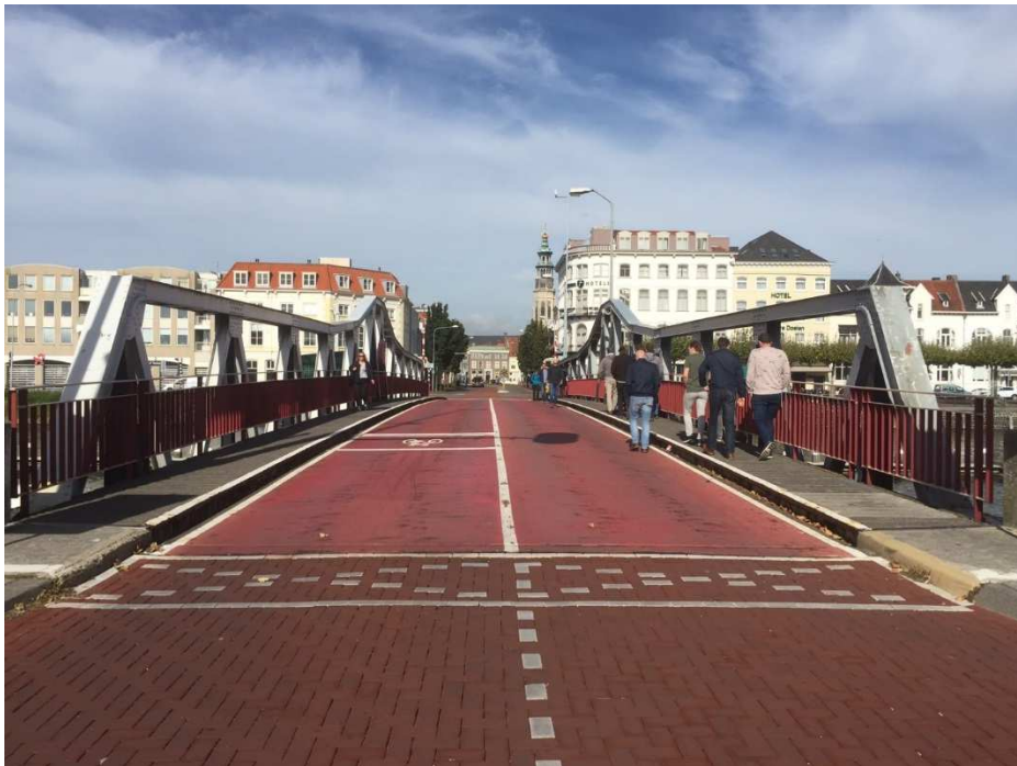
Figuur 1: Stationsbrug gezien vanaf NS-station richting Stadscentrum

Door de provincie Zeeland is de renovatie van de Stationsbrug in Middelburg aanbesteed en begin dit jaar gegund aan Hollandia Service B.V. Nadat in een latere fase van dit project, Chromo VI in de coating is geconstateerd, is in september dit jaar het werk geschorst. HaskoningDHV Nederland (RHDHV) is gevraagd om de Provincie Zeeland te adviseren omtrent de verschillende mogelijkheden voor renovatie en eventuele alternatieven/varianten. Daar het reinigen en stralen van coating met zware metalen als een probleem wordt beschouwd, zijn alternatieve methoden geselecteerd en is nader onderzoek voorgesteld.