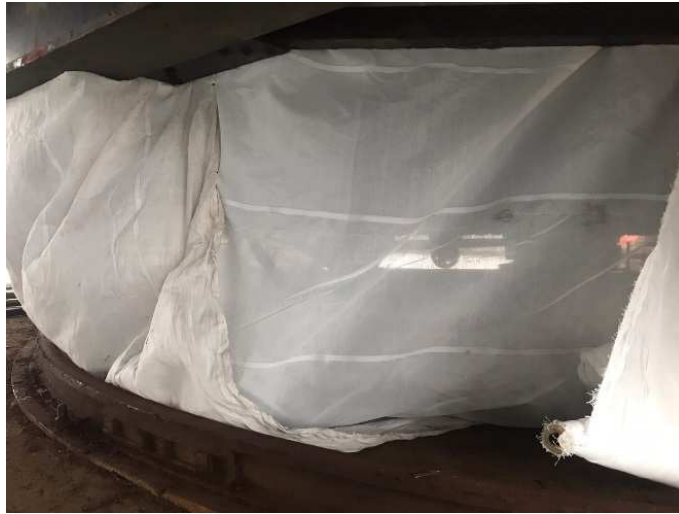
Figuur 3 De proeflocatie met ingepakt draaimechanisme

De proeflocatie is aan de onderzijde van de draaibrug, rond het draaimechanisme, op de pijler van de brug.