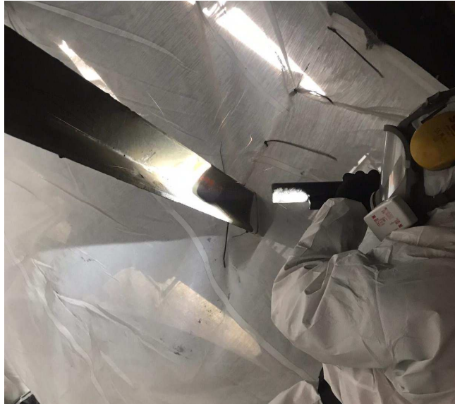
Figuur 5: Het straalproces

Er is gestraald op het substraat (zie figuur 3 & 4) met Silver 30 SpongeMedia™ (Artnr: SJM-S-30). Dit is een straalmiddel gebaseerd op Aluminiumoxide met grit # 30. Er is gestraald onder een druk van de straalketel van 5,2 bar (zie figuur 3), met een Saber (SBR) #8 straalpijp en een media toevoer van 2,6 bar.