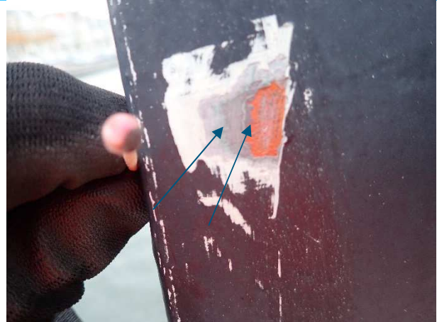
Foto 2: test op Chromium VI op hanger, staafje is (op foto moeilijk te zien) verkleurd als gevolg van aanwezigheid chromium VI, waarschijnlijk in de groene lagen (zie pijlen), oranje is overduidelijk loodmenie