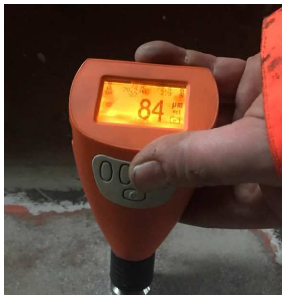
Figuur 6: Laagdikte meting.

Op een tweede deel van de constructie, waar wel Chroom VI in bleek te zitten, is opnieuw gestraald. De straalsnelheid was circa 4 m 2 per uur, bij een laagdikte van circa 1900 μ.