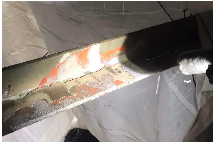
Figuur 7: Een gestraald onderdeel van de brug