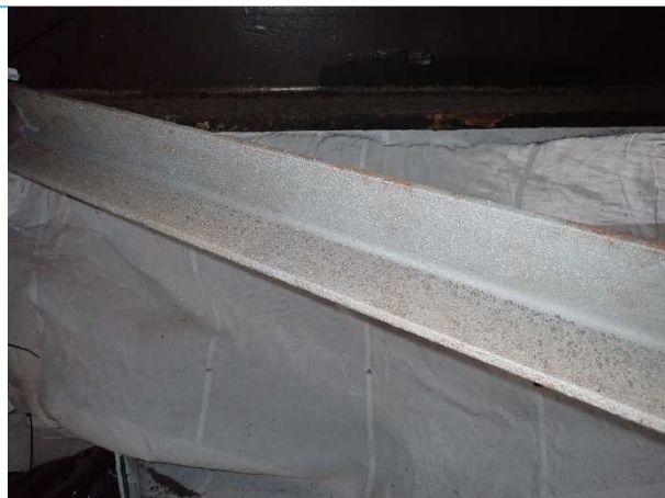
Foto 3: Gestraald windverband waarop Chromium VI is aangetroffen. Bij stralen zijn blootstellingsmetingen gedaan