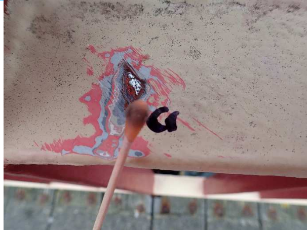
Foto 1: test op Chromium VI op de leuning. Geen rode verkleuring van het staafje, geen Chromium VI aanwezig op deze plaats.