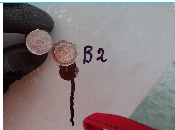
Foto 6: meetresultaat pull off op hoofddragconstructie boven rijbaan. 100% cohesief in 2 e laag (C)