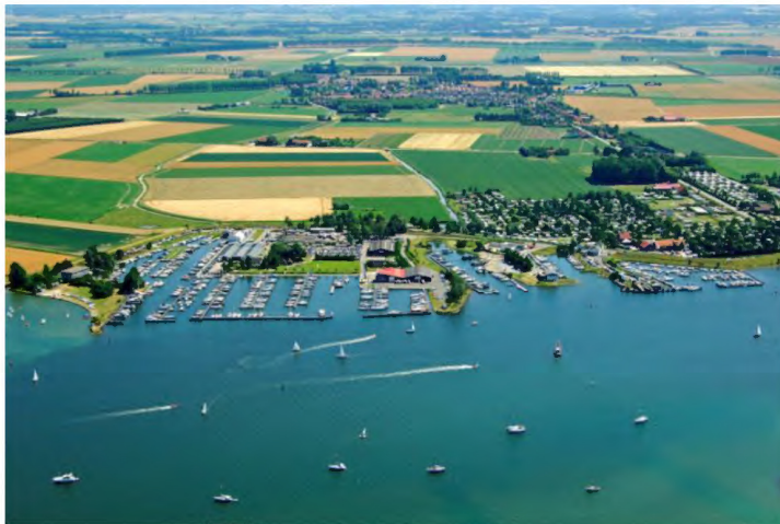
Beginsituatie Recreatiegebieden rondom Wolphaartsdijk vanaf 1961