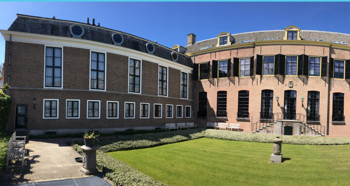
Achterzijde Zeeuws Archief. Het Van de Perrehuis met kantoren en de Lussanetvleugel met het restauratieatelier, het nieuwbouw gedeelte met de depots en de publieksruimtes, waaronder de studiezaal.