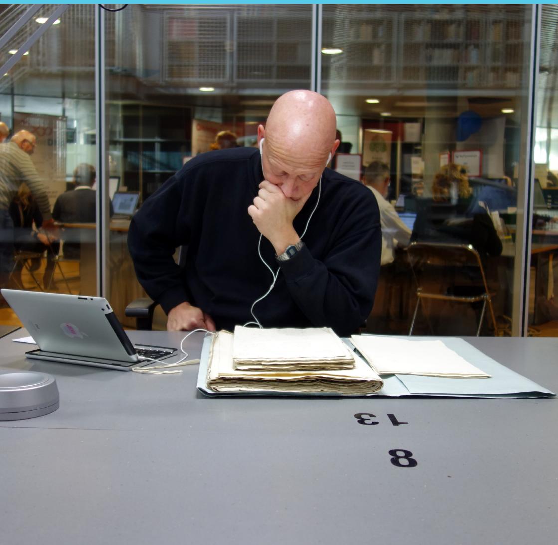
Onderzoek in de studiezaal van het Zeeuws Archief.