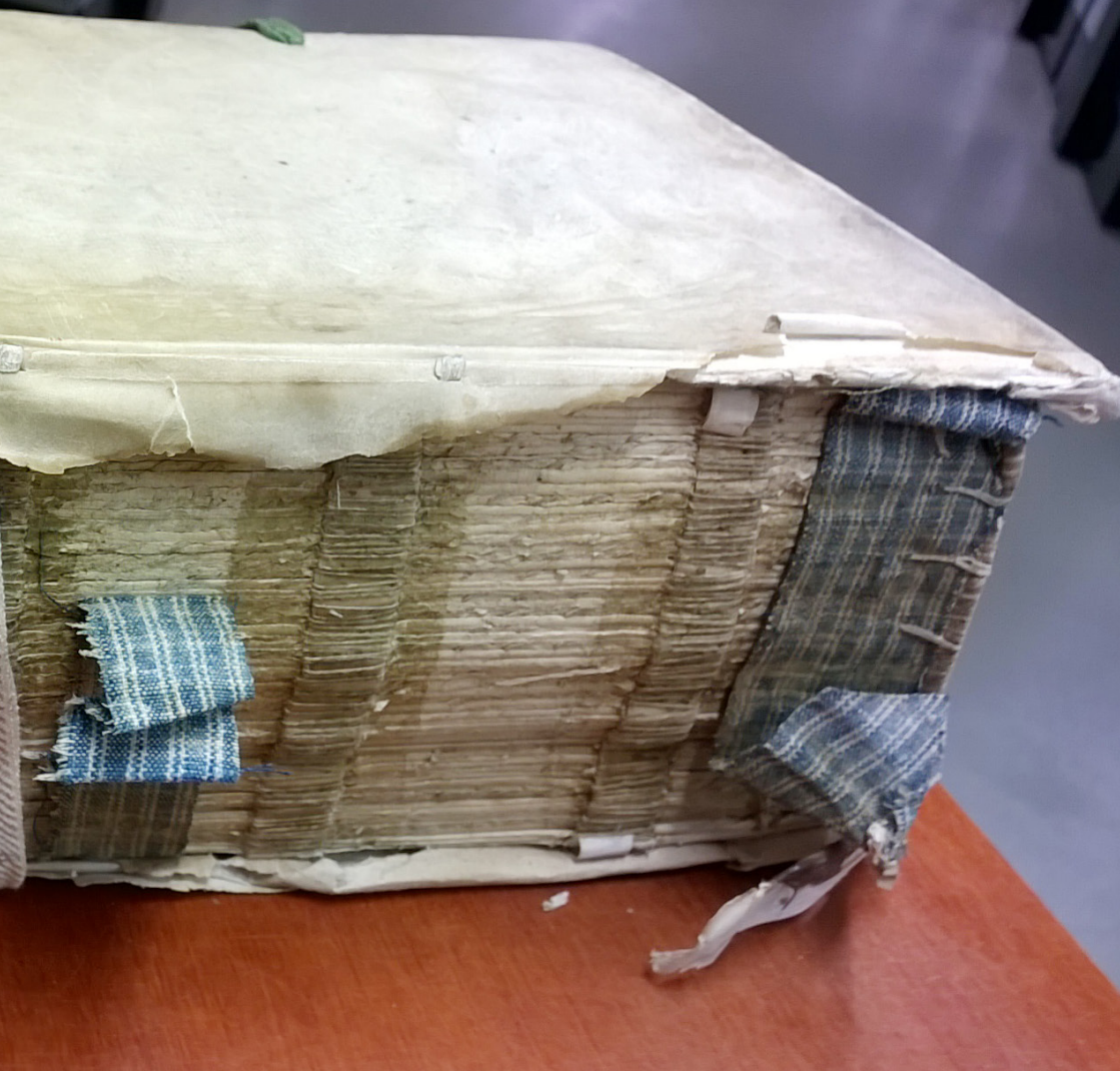
Metamorfoze project – register van het archief van de deputaten Oost- en West-Indische zaken van de classis Walcheren, met perkamenten spitselband en rugbeleg met katoen.