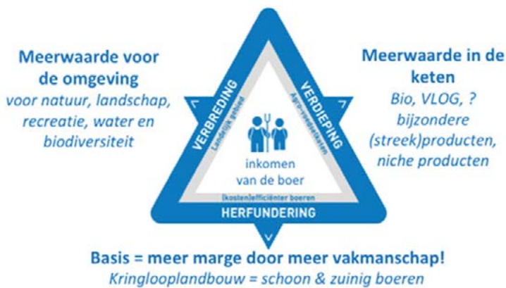
Figuur 1: Meerwaarde creëren op het agrarisch bedrijf

Die wederzijdse kruisbestuiving tussen landbouw, natuur, biodiversiteit en klimaat gaan we zoveel mogelijk bevorderen. Door het nemen van concrete maatregelen: maatwerk op lokaal niveau. Dat doen we door het verbinden van doelen, het formuleren van gezamenlijke ambities en door het (weer) samenbrengen van partijen.