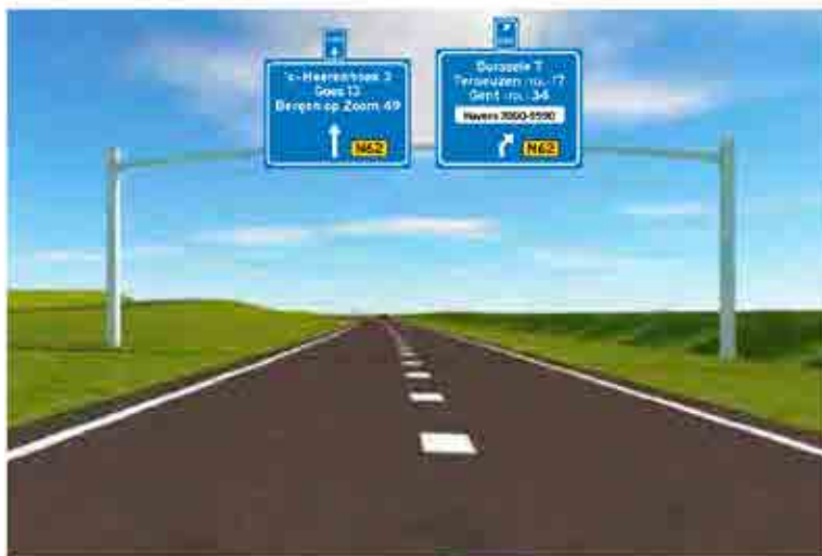
A Route vanuit Middelburg richting Goes en Terneuzen