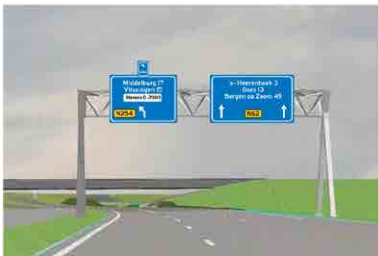
C Route vanuit Terneuzen richting Middelburg en Goes