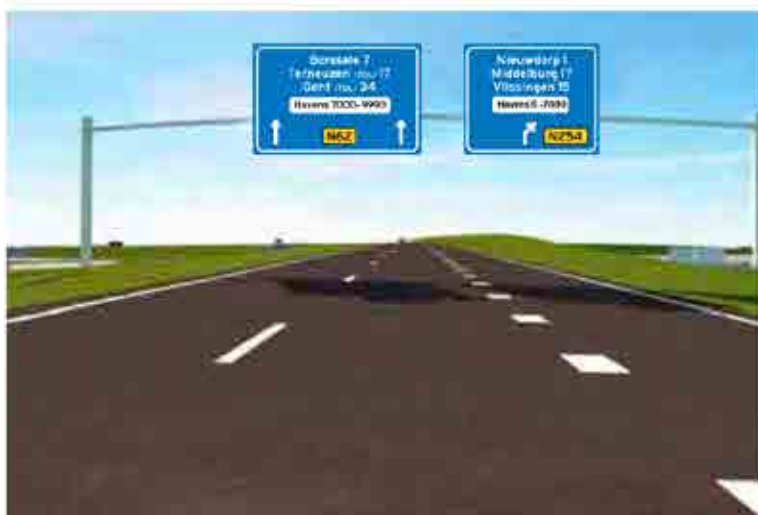
B Route vanuit Goes richting Terneuzen en Middelburg