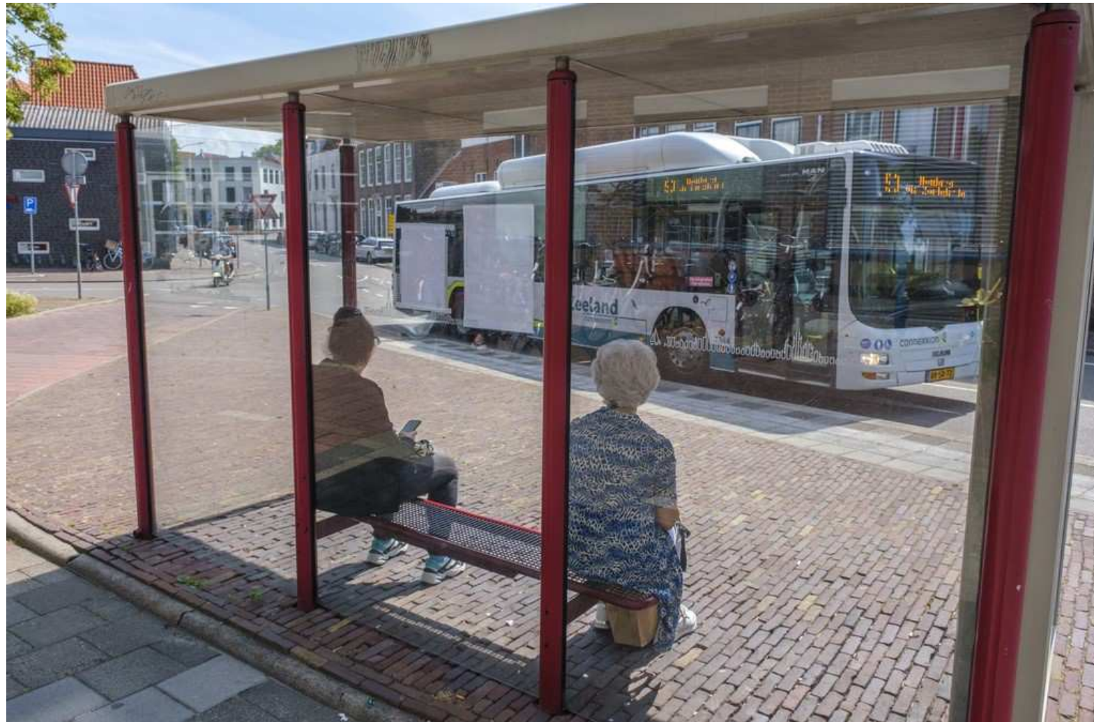
BUSHALTE AAN DE KOESTRAAT IN MIDDELBURG.

MIDDELBURG STEEDS MEER PROTESTEN tegen plan