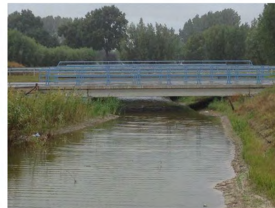
brug met doorlopende oever