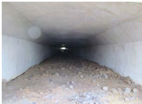
duiker met loopstrook