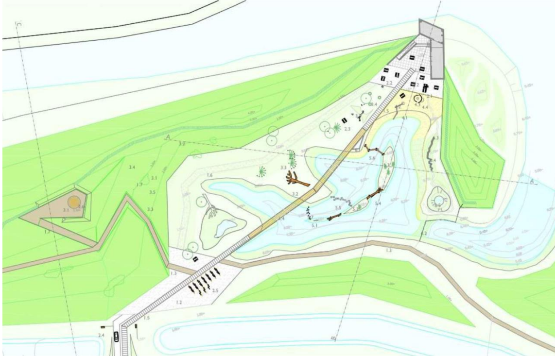
juni 2017: impressie Welkom in Waterdunen

Het Zeeuwse Landschap werkt momenteel een voorstel uit om voor een entreevoorziening gecombineerd met speelnatuur. Zij verzoeken de Provincie het budget uit de GREX 2017 voor speelnatuur en voor de grote vogelkijkhut in te brengen in hun plan, waarna zij dit voor eigen risico realiseren. Daarbij wordt aanvullende financiering ingezet: een bijdrage van Molecaten voor speelnatuur, een bijdrage van Het Zeeuwse Landschap vanuit haar budget voor de kleinere vogelkijkhutten en een eventuele bijdrage vanuit het Rood voor Groenfonds. Medio 2018 is goedkeuring gegeven voor extra bijdrage Rood voor Groen door gemeente Sluis.