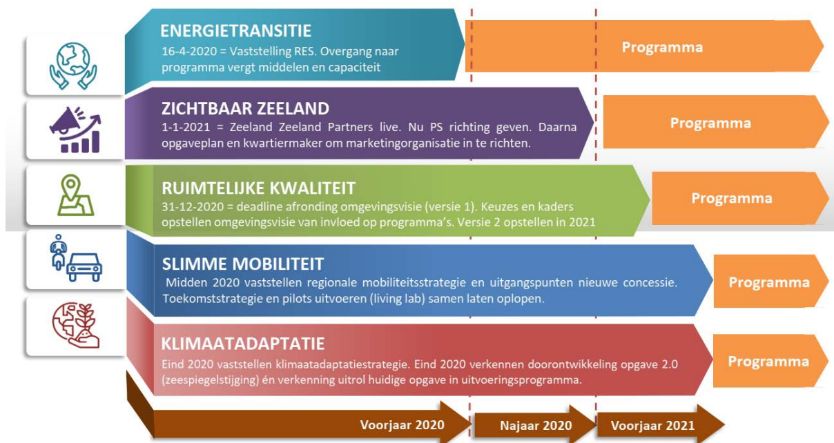
Figuur opgaven: dit figuur is opgesteld voor het uitbreken van de crisis, vanwege vertraging die nu optreedt schuiven ook de genoemde data naar alle waarschijnlijkheid naar achteren.

De strategische opgaven richten zich op de grote vraagstukken voor de komende periode, die ook onderling samenhangen. De opgaven zijn dynamisch en per definitie tijdelijk. Opgaven leiden tot een strategisch plan, dat vervolgens via een uitvoeringsprogramma wordt uitgevoerd. Voor de vijf opgaven die in het coalitieakkoord zijn benoemd geldt een eigen planning en timing: