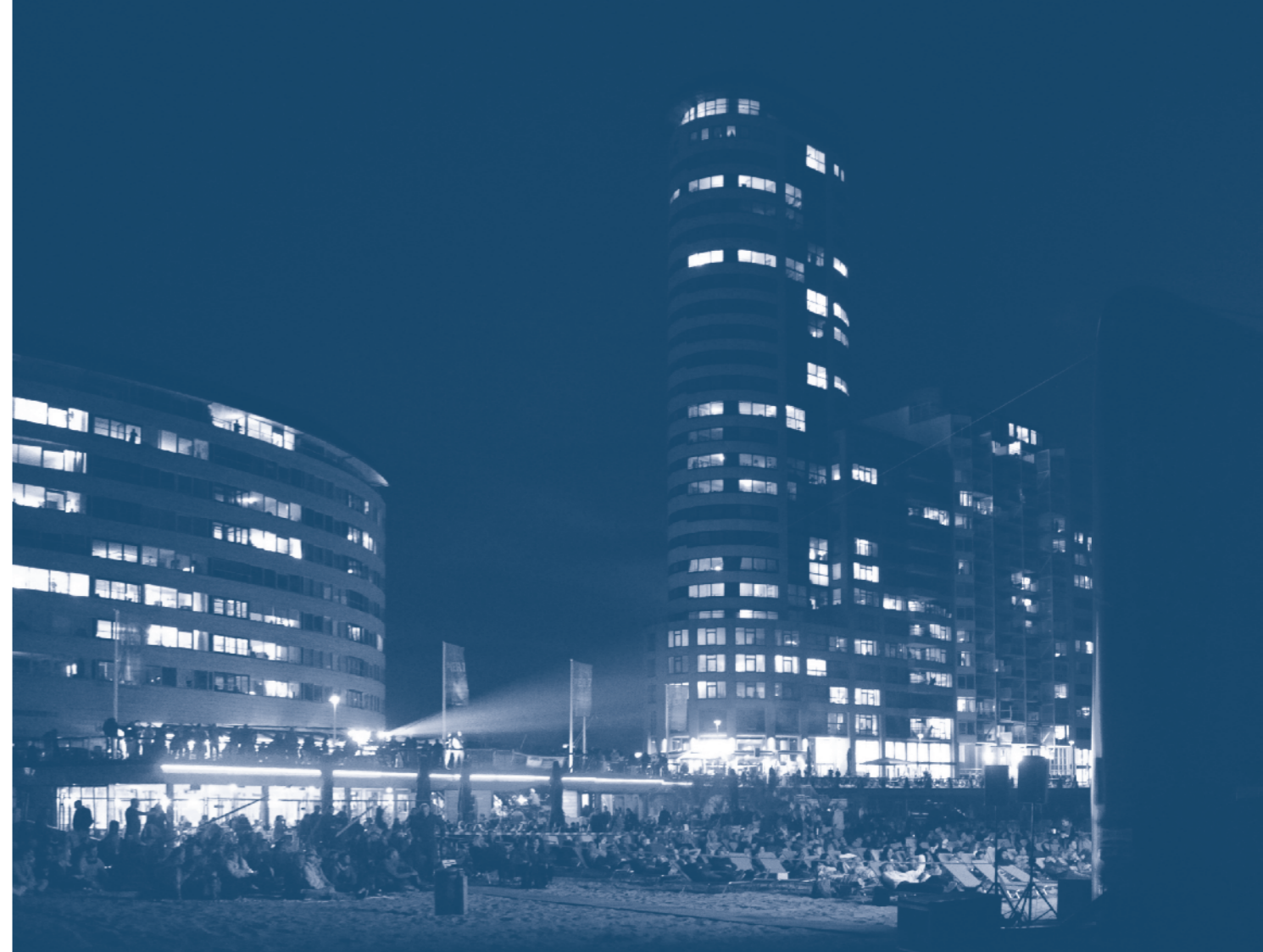
film by the sea