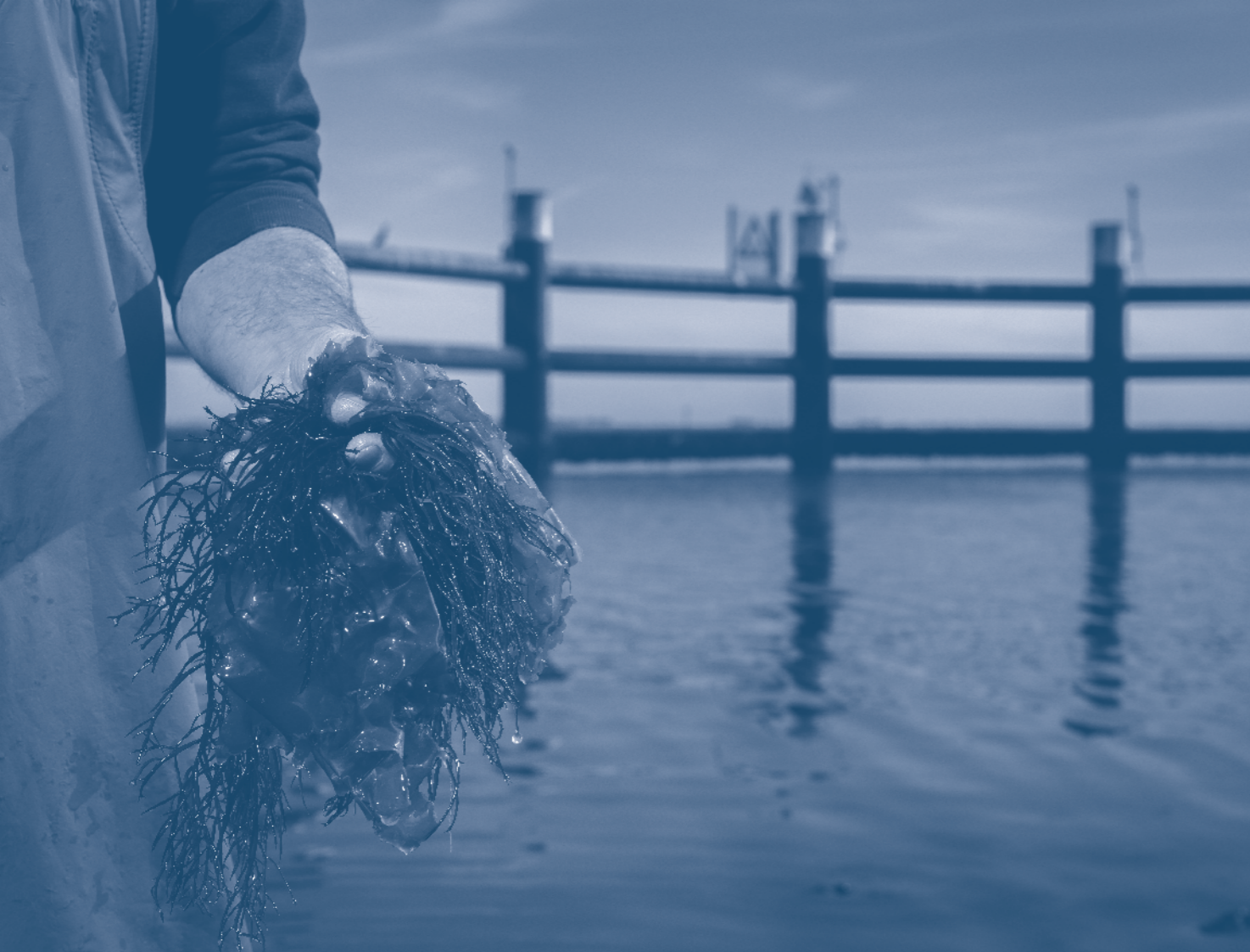
zilt ~ jan de carpentier