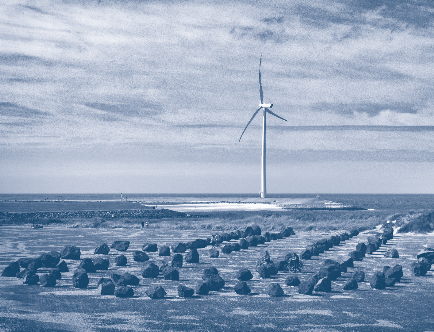
abri / kathedraal ~ mainus boezem