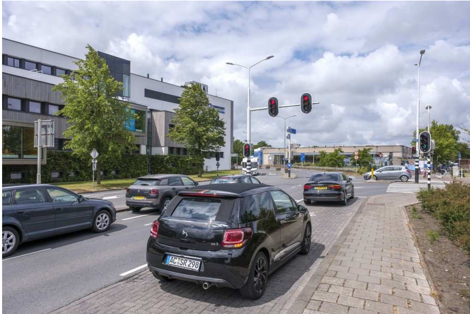
HET GROENE WOOD IN MIDDELBURG WAAR TEGENOVER DE HZ EEN NIEUWE BUSHALTE ZOU MOETEN KOMEN.