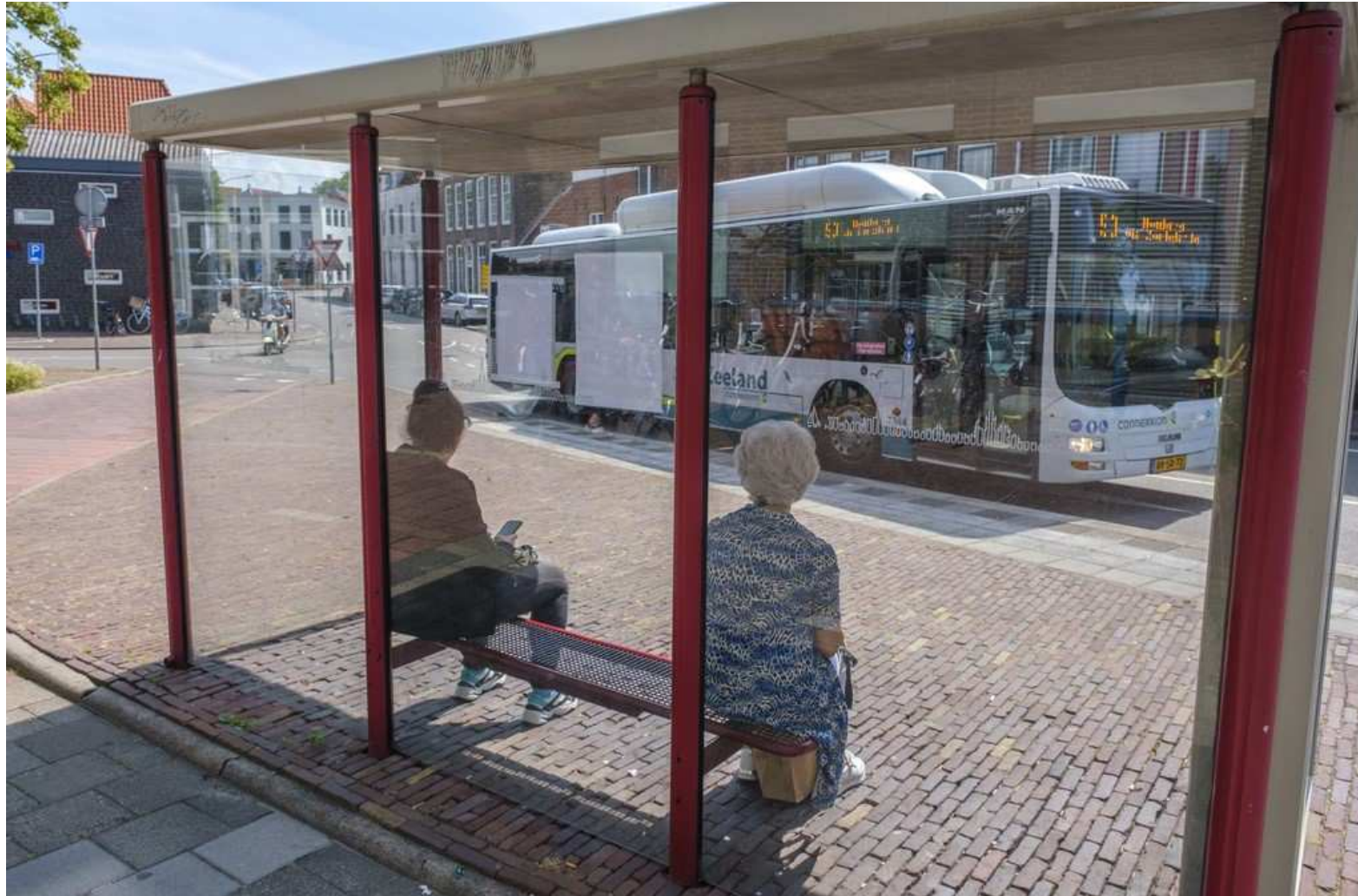
BUSHALTE AAN DE KOESTRAAT IN MIDDELBURG.

MIDDELBURG STEEDS MEER PROTESTEN tegen plan