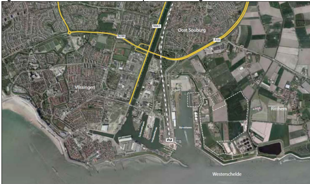
Figuur 2.1 Luchtfoto met locatie MARKAZ ten opzichte van Vlissingen