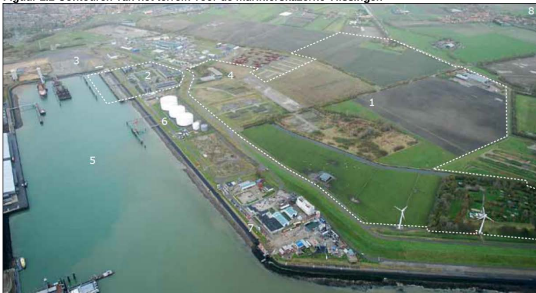
Figuur 2.2 Contouren van het terrein voor de marinierskazerne Vlissingen

(1) locatie MARKAZ (gedeeltelijk), (2) Marinekazerne Vlissingen, (3) voormalig OLAU terrein, (4) Mobilisatiecomplex, (5) Buitenhaven, (6) Vesta Terminal Flu)shing, (7) brandweeroefencentrum, (8) dorpskern Ritthem.