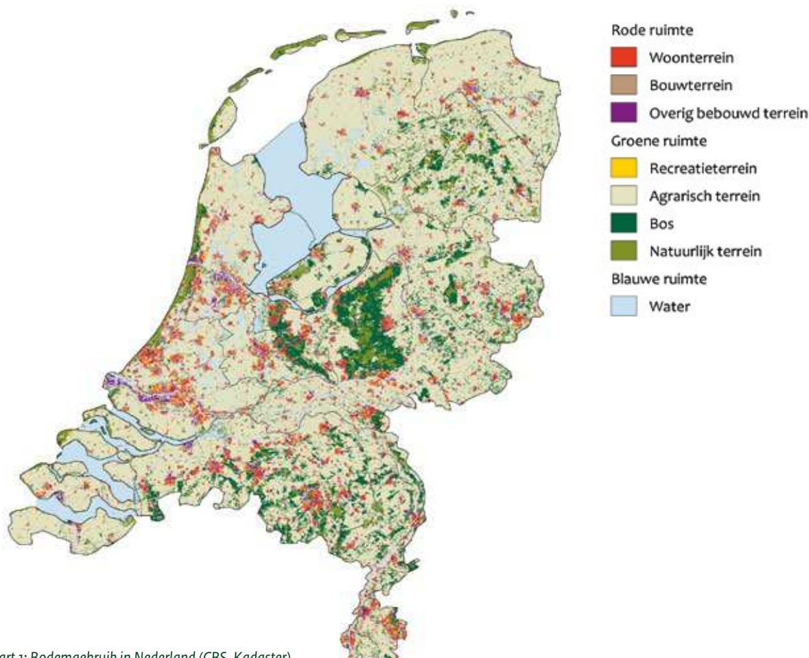
Kaart 1: Bodemgebruik in Nederland (CBS, Kadaster)

Maar soms moeten we andere keuzes maken, om bijvoorbeeld de veiligheid te borgen of om ruimte te creëren voor nieuwe woningen. In het reguliere beheer worden bomen gekapt voor verjonging en productie (zie het thema 'Vitaal bos'). Ook is het soms nodig om bos om te vormen naar andere typen natuur. Dat komt omdat het in Nederland slecht is gesteld met de plant- en diersoorten die afhankelijk zijn van open landschappen, zoals heide. Dit komt vooral door de hoge stikstofneerslag. We blijven daarom de herstelmaatregelen voor deze kwetsbare natuur uitvoeren.