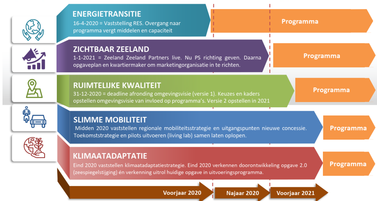
Figuur opgaven: dit figuur is opgesteld voor het uitbreken van de crisis, vanwege vertraging die nu optreedt schuiven ook de genoemde data naar alle waarschijnlijkheid naar achteren.

De strategische opgaven richten zich op de grote vraagstukken voor de komende periode, die ook onderling samenhangen. De opgaven zijn dynamisch en per definitie tijdelijk. Opgaven leiden tot een strategisch plan, dat vervolgens via een uitvoeringsprogramma wordt uitgevoerd. Voor de vijf opgaven die in het coalitieakkoord zijn benoemd geldt een eigen planning en timing: