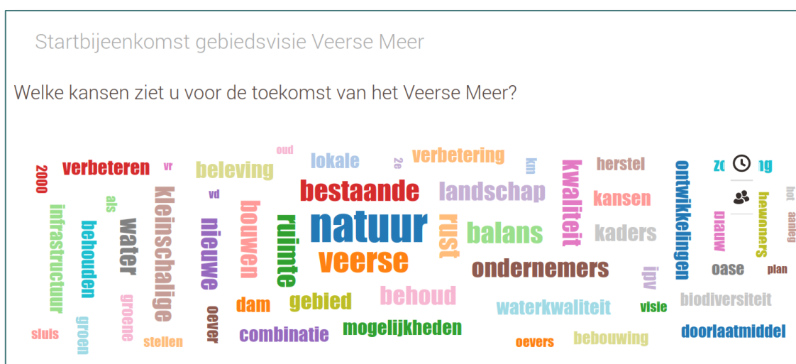
Figuur 2: Wordle van door de deelnemers benoemde kansen