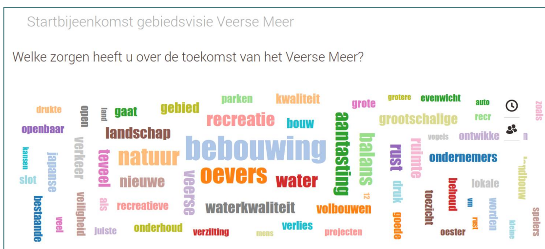
Figuur 1: Wordle van door de deelnemers benoemde zorgen

In twee gespreksrondes, in groepen van 7 á 8 deelnemers en onder begeleiding van een gespreksleider, ging men met elkaar in gesprek over de zorgen en kansen die men ziet voor de toekomst van het Veerse Meer. Na afloop van elke ronde konden deelnemers hun belangrijkste zorgen en kansen indienen via een online tool. Het overzicht van alle inzendingen werd middels een z.g. Wordle geprojecteerd en besproken. In een wordle geeft de grootte van elk woord aan hoe vaak de deelnemers dit onderwerp als zorg of kans benoemden.