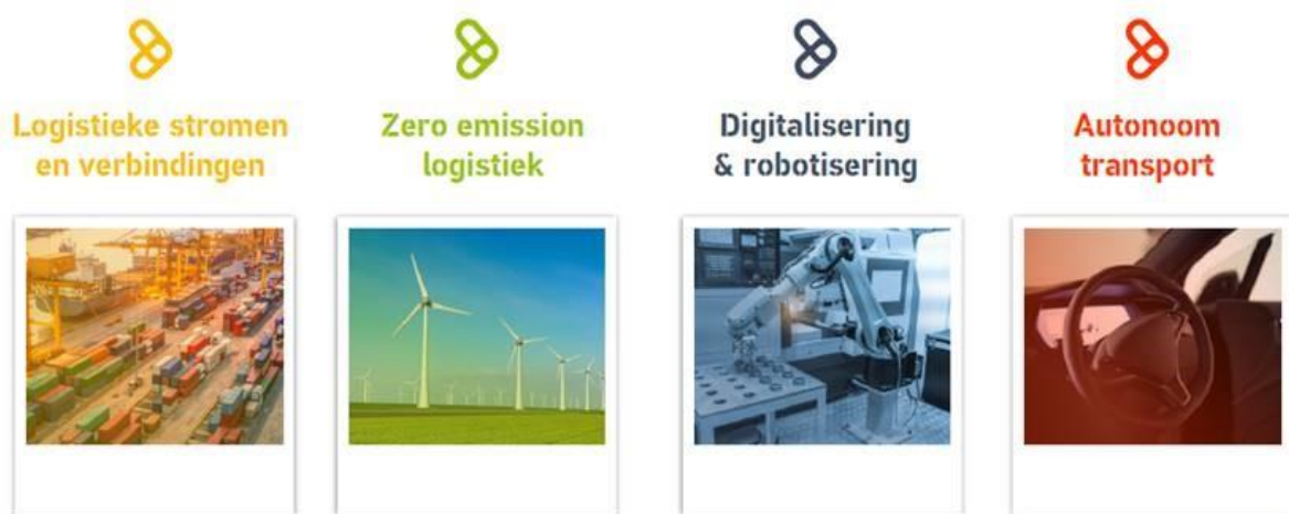
De 4 innovatielijnen van Zeeland Connect

Zeeland is als logistieke testomgeving interessant omdat onze regio een relatief grote en diverse logistieke sector kent. Alle modaliteiten zijn in de regio sterk zijn vertegenwoordigd en de lijnen zijn kort. Daarnaast heeft Zeeland nauwelijks last van de congestieproblematiek van de Europese Mainports, waardoor er veel ruimte is om nieuwe ontwikkelingen uit te testen. Deze nieuwe ontwikkelingen betreft vooral schone en duurzame transportmiddelen, autonoom transport, digitalisering & robotisering, circulaire economie en supply chains en specifieke innovaties zoals de toepassing van slimme verkeerslichten en connected transport corridors.