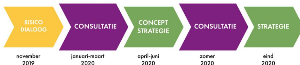
Figuur 1. Overzicht van het voorgenomen proces van de totstandkoming van de KaSZ