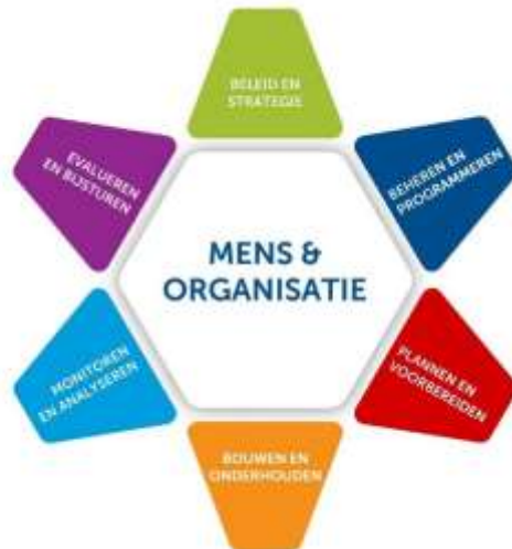
Figuur 1: de assetmanagementroos