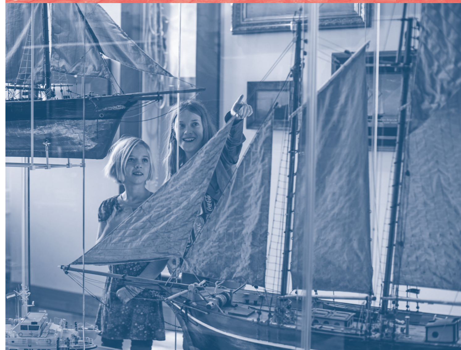
zeeuws maritiem museum

~ Voor de creatieve ontwikkeling van leerlingen in het Zeeuwse onderwijs, de komende jaren, is het cruciaal dat iedereen in de omgeving van de leerling goed is toegerust om hen daarin te kunnen begeleiden: leerkrachten, zelfstandige kunstenaars en culturele instellingen. Leo Adriaanse ~ Cultuurkwadraat