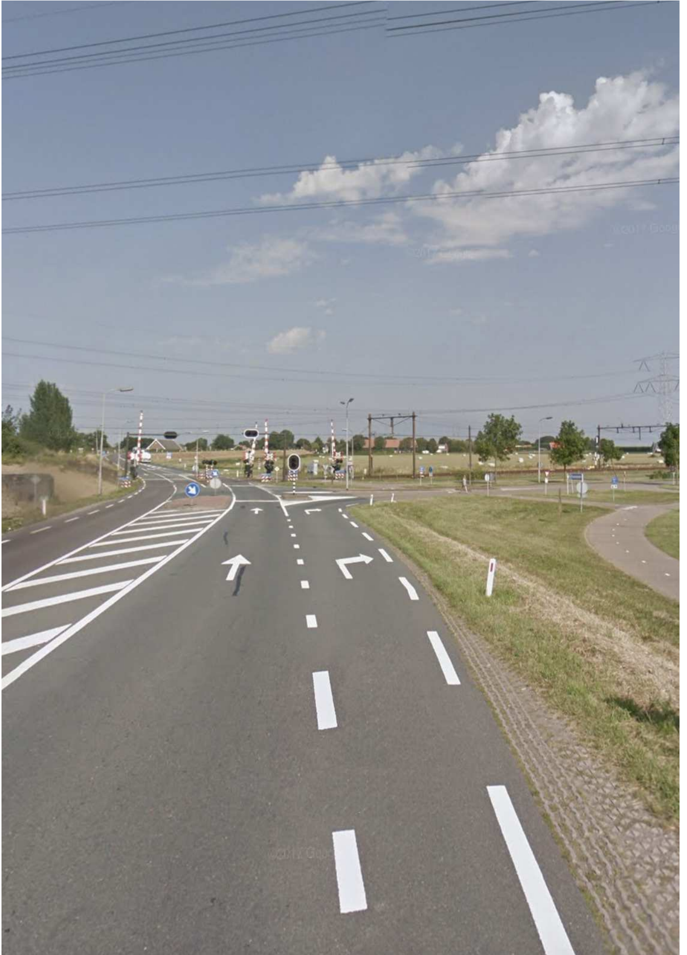
GEBIEDSONTSLUITING YERSEKE EN KRUIJINGEN stedenbouwkundige onderbouwing d.d. 6 november 2017