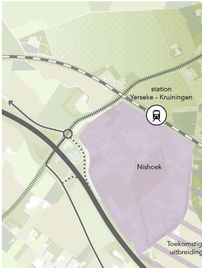
afwaarderen afslag Yerseke en Zanddijk