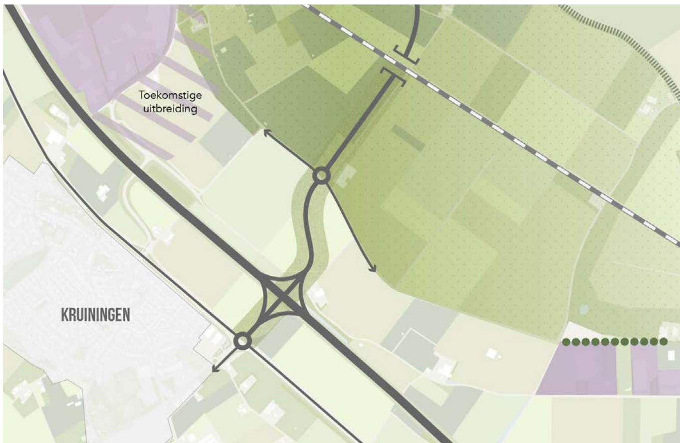
nieuwe volwaardige afslag Kruiningen - Yerseke