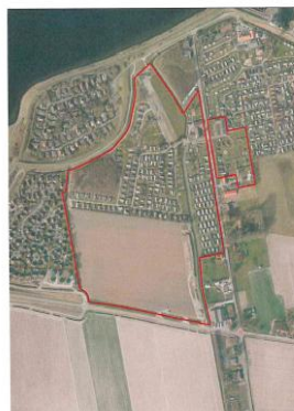
Figuur 1. plangebied

Het plangebied van dit bestemmingsplan en de wegenstructuur in de omgeving zijn weergegeven op de onderstaande luchtfoto en straatnamenkaart.