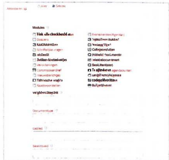
Afbeelding 5: Voorbeeld functie 'Attenderen op'