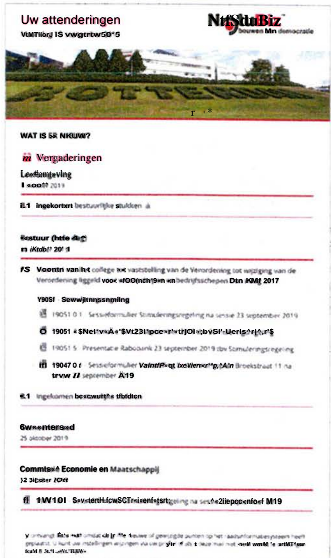
Afbeelding 1; Voorbeeld attenderingsmail

Er wordt voor gebruikers en geabonneerden automatisch een attenderingsmail gestuurd naar het opgegeven e-mail inclusief hyperlinks naar de agenda's en/of documenten. Zo kan alle informatie eenvoudig en direct vanuit de mail bekeken worden. De e-mail is voor u in te stellen met uw eigen huisstijl. Zo kan een eigen header en logo worden ingesteld en is tevens de kleur naar wens van de gemeente in te stellen. Gebruikers en geabonneerden ontvangen daarmee een e-mail die aansluit op uw specifieke huisstijl.