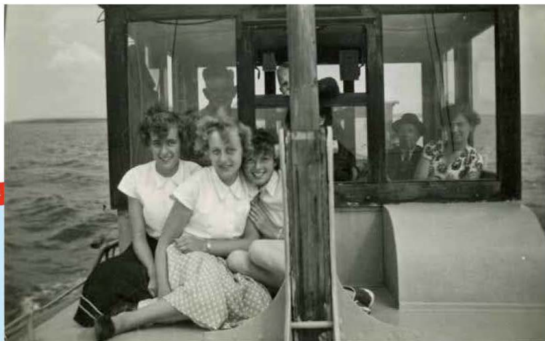
Foto: Firma J. Torbijn, Zeeuws Archief, Fotoarchief J. Torbijn, BRG-P-9.

De Zeelandbruggen Noord-Beveland en Schouwen in aanbouw, 1964.