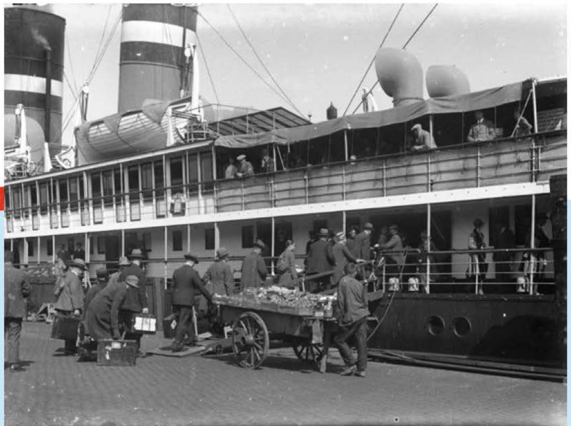
Foto: P.J. Kluij, Zeeuws Archief, Fotocollectie Vlissingen, nr 4-477.

Passagiers gaan aan boord van een schip van de Stoomvaart Maatschappij Zoeland (SMZ) in de Buirenhaven te Vlissingen, 1930-1935.