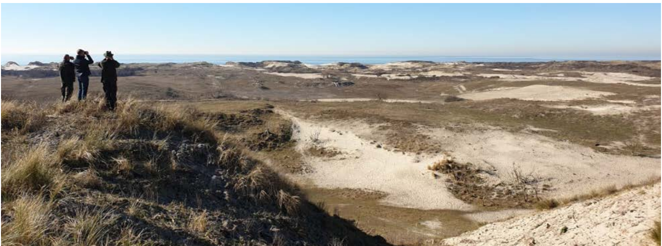
Herstelmaatregelen ter bevordering van de duindynamiek op de Kop van Schouwen.

De eerste drie jaar gebruiken we daarnaast ook om te monitoren en te bepalen welke maatregelen effectief zijn om vanaf 2023 op te nemen in onze Natura 2000-beheerplannen.