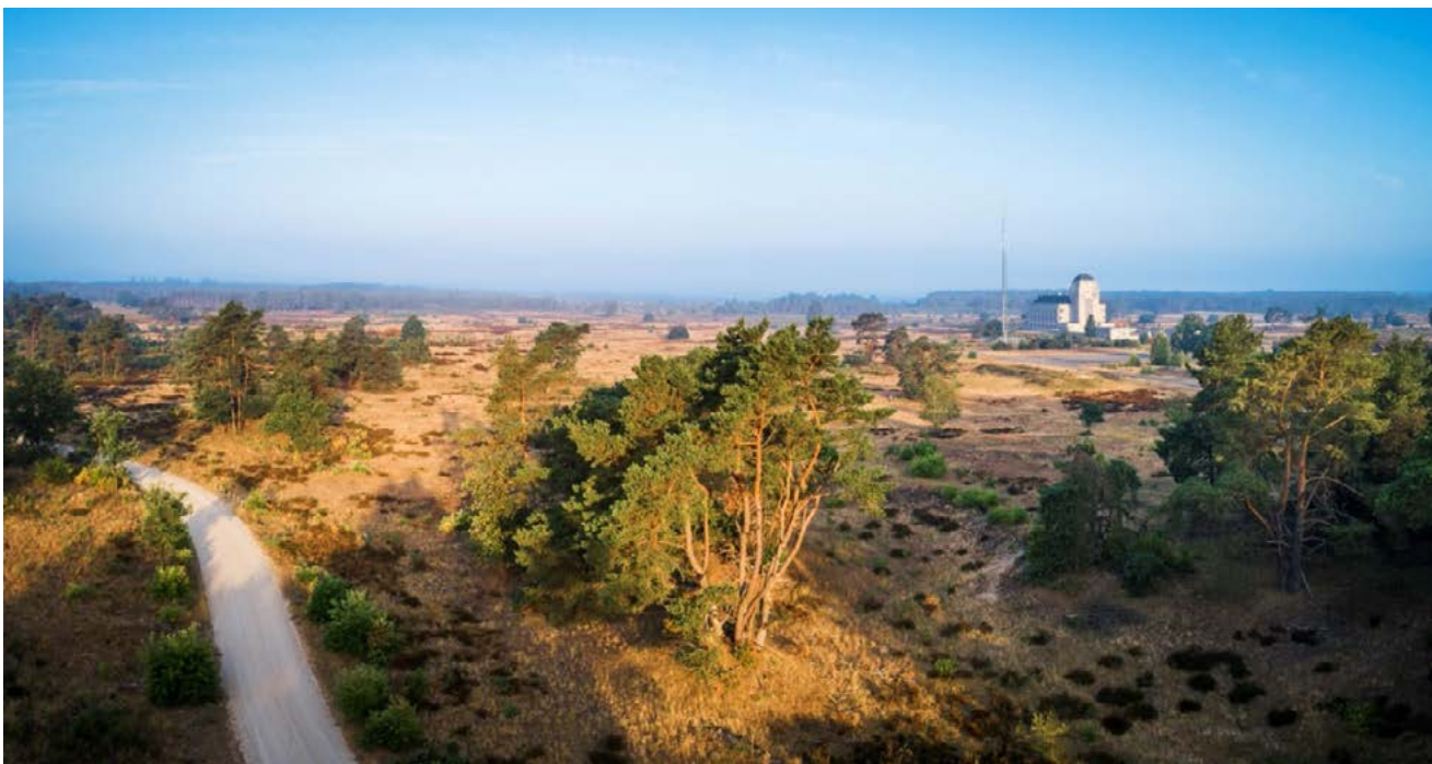
Radio Kootwijk: de grootste actieve zandverstuivingen van West-Europa.

Het Gelderse maatregelenpakket bestaat uit vijf onderdelen: 'natuurbeheer op orde', herstel van bestaande natuurgebieden, natuurinclusieve versterking in het agrarisch gebied rondom natuurgebieden, versterking natuurnetwerk in overgangsgebieden, en onderzoek, monitoring en evaluatie.