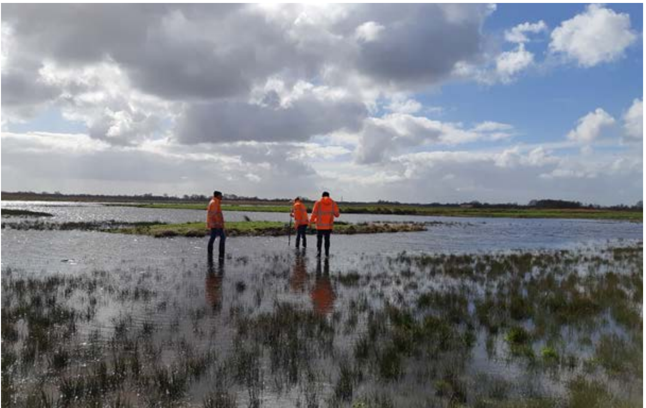
Potentieel blauw grasland met natuurlijk peil in de Oostelijke Vechtplassen.

Voor de langetermijnmaatregelen (drie tot en met tien jaar) gaan we nadere analyses uitvoeren. Deze leggen we vast in aangepaste Natura 2000-beheerplannen. Dit borgt het benodigde natuurherstel voor de lange termijn.