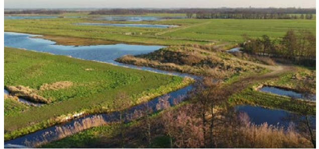
Recreanten welkom op uitzichtheuvel, midden in Natura 2000.

Daarnaast dachten op ons verzoek de Utrechtse waterschappen mee. Zij hebben hydrologische maatregelen voorgesteld, gericht op het optimaliseren van de inrichting en het versneld verbeteren van de (water)kwaliteit.