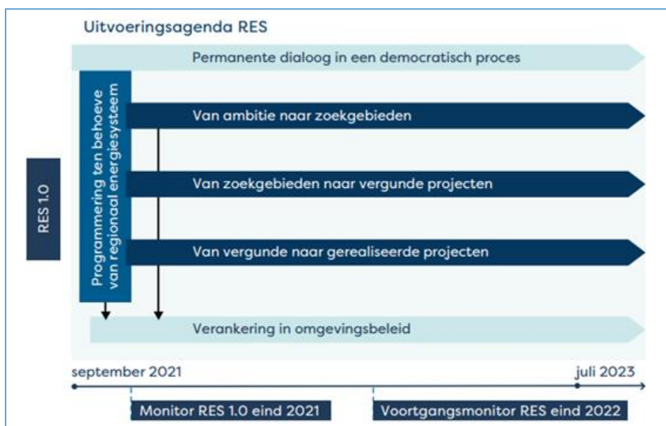
Figuur 2: Van RES 1.0 naar RES 2.0

De RES 1.0 en het uitvoeringsplan zijn omvangrijke documenten. De RES 2.0 heeft als doel focus aan te brengen. We zetten daarom in op een actiegericht document waarbij strategie en uitvoering gezamenlijk opgaan.