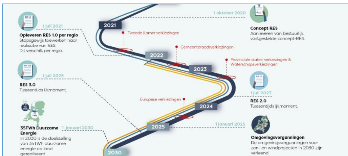
Figuur 1: RES op weg naar 2050

De partners van het Zeeuws Energie Akkoord (ZEA) staan daarmee voor de opgave om de RES 1.0 uit te voeren en tegelijkertijd de RES 2.0 te ontwikkelen. In voorliggende notitie wordt een procesvoorstel gedaan voor het opstellen van de RES 2.0.